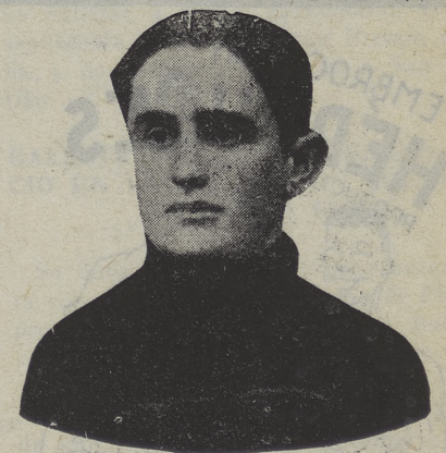
Vicente Trueba, el incomparable "trepador" de la Vuelta a Francia, que ha ganado el Gran Premio de la Montaña

Clase más de 2.000 c. c.—1, Pietsch, Alfa Romeo, 2' 10" 5-10 (media 109,9).