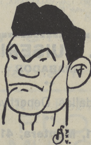
Paulino Uzcudum, que, en su combate con Pierre Charles, recuperó el título de Campeón de Europa de pesos fuertes