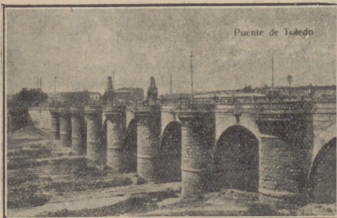
Puente de Toledo