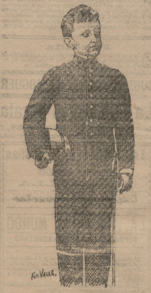
D. Alfonso XIII