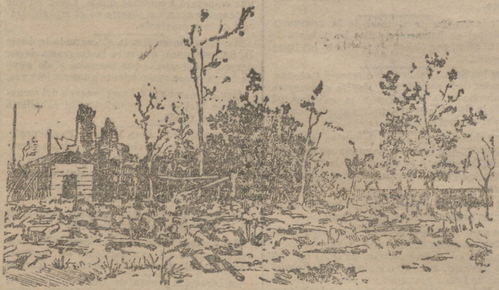
CÁRDENAS.—La casa vivienda del ingenio Araujo, demolido por Maceo

En la conferencia que anoche celebraron los Sres. Beranger y Cánovas, el ministro de Marina expuso al presidente del Consejo el estado de las obras del acorazado Carlos V .