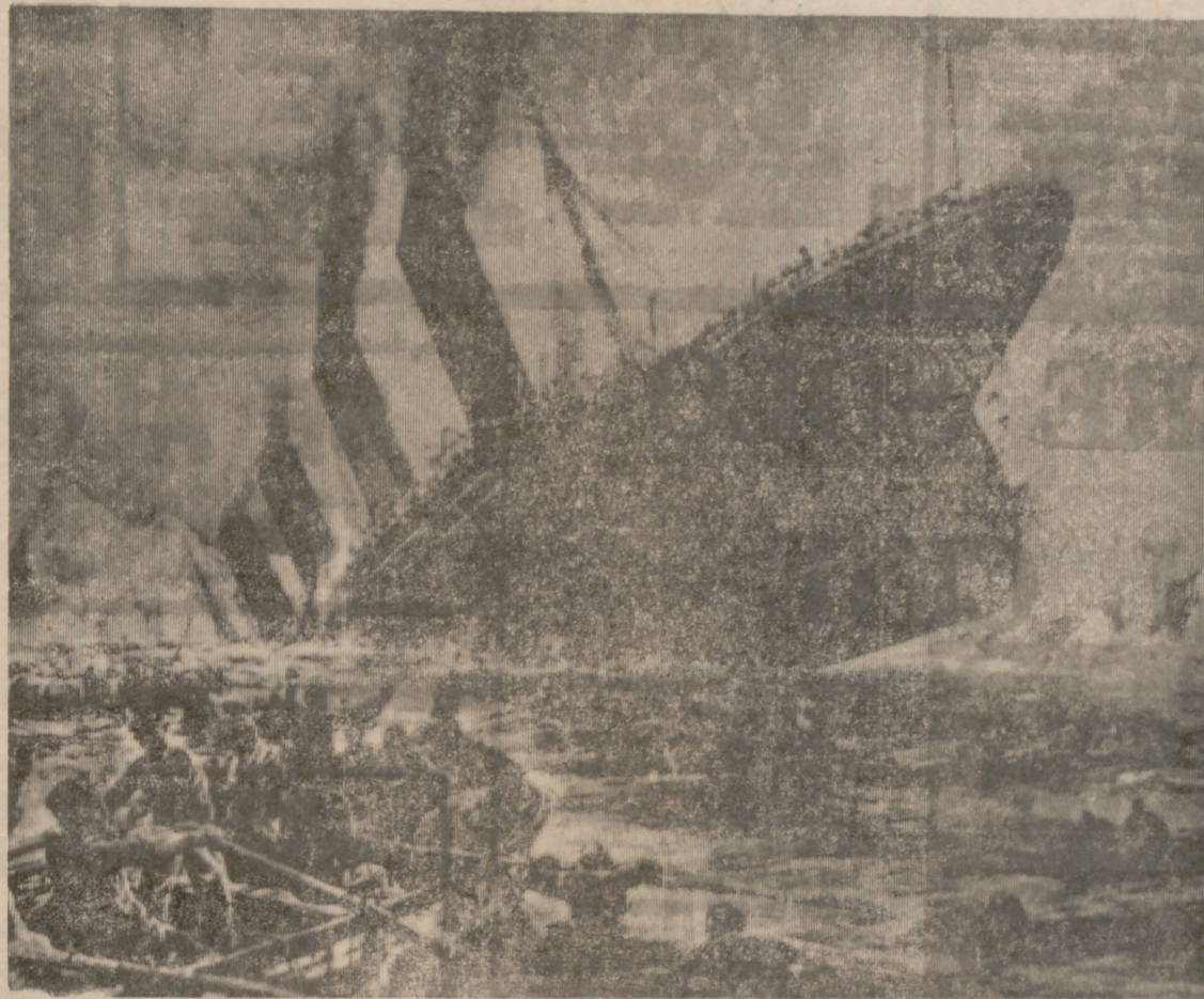
En la primavera próxima se intentará de nuevo el rescate de los tesoros que se hundieron con el «Titanic».