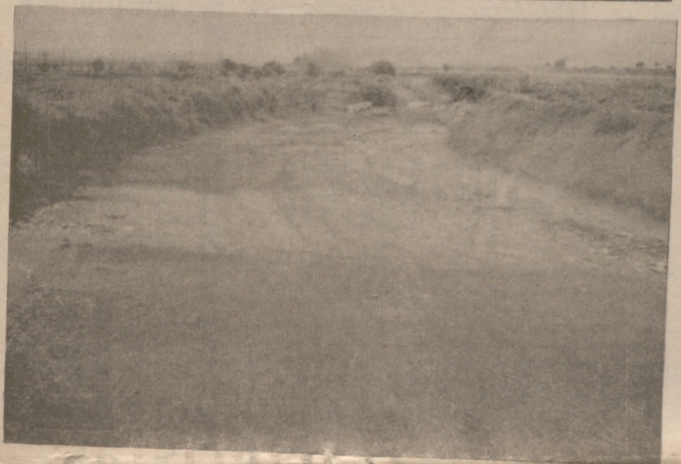
ALFARO. — (De nuestro corresponsal, González Vicente). Hace ya muchos meses

que las obras de asfaltado del camino a Castejón se habían paralizado, casi casi en la mitad de su recor-