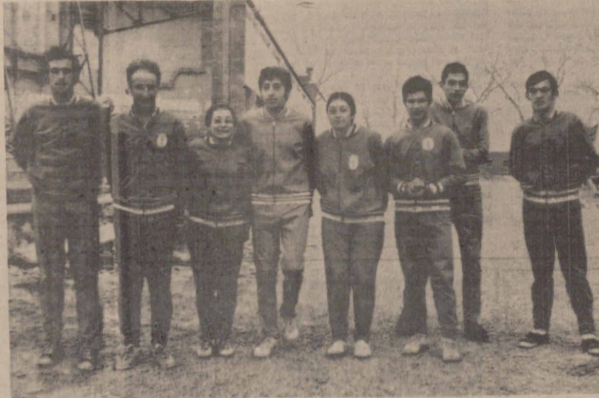
Estos son los atletas que van a tomar parte en la prueba internacional del Cross de Lasarte.