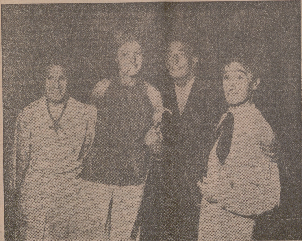
Salvador Dalí y su esposa, Gala, con el bailarín es pañol Vicente Escudero, tras una actuación de este último en Barcelona.