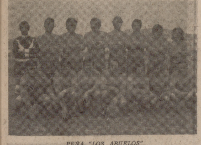
PEÑA "LOS ABUELOS"