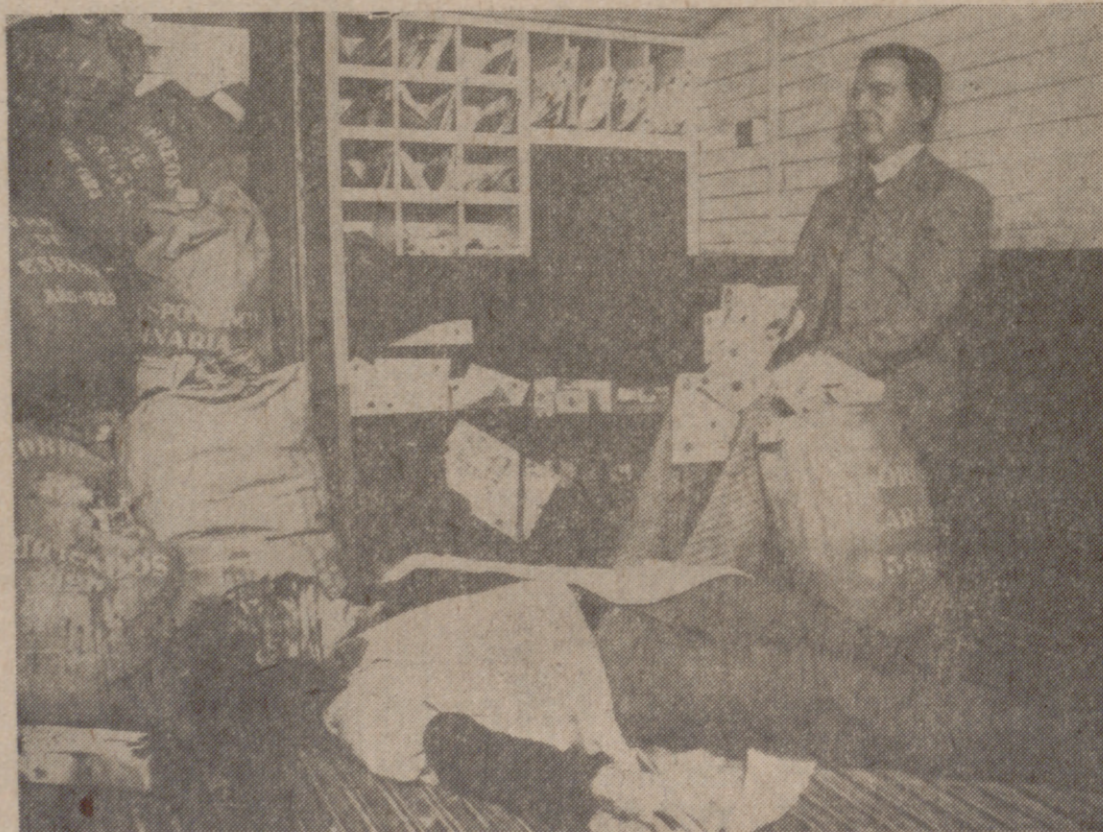
El crimen del expreso de Andalucía, en una de sus secuencias.

La "vedette" de esta panoplia del terror es la reproducción del asalto al expreso de Andalucía, un atraco que cincuenta años después de ser cometido permanece vivo en el recuerdo de muchas personas. Los profesionales del Museo de Cera han realizado una auténtica labor de artesanía. Los muertos parecen estar todavía agonizantes. Los criminales tienen auténtica cara de malvados. El "atrezzo" es perfecto: las ropas, los decorados, la sangre que lo saúpa todo, están llenos de un acierto de verosimilitud verdaderamente emocionante. La his-