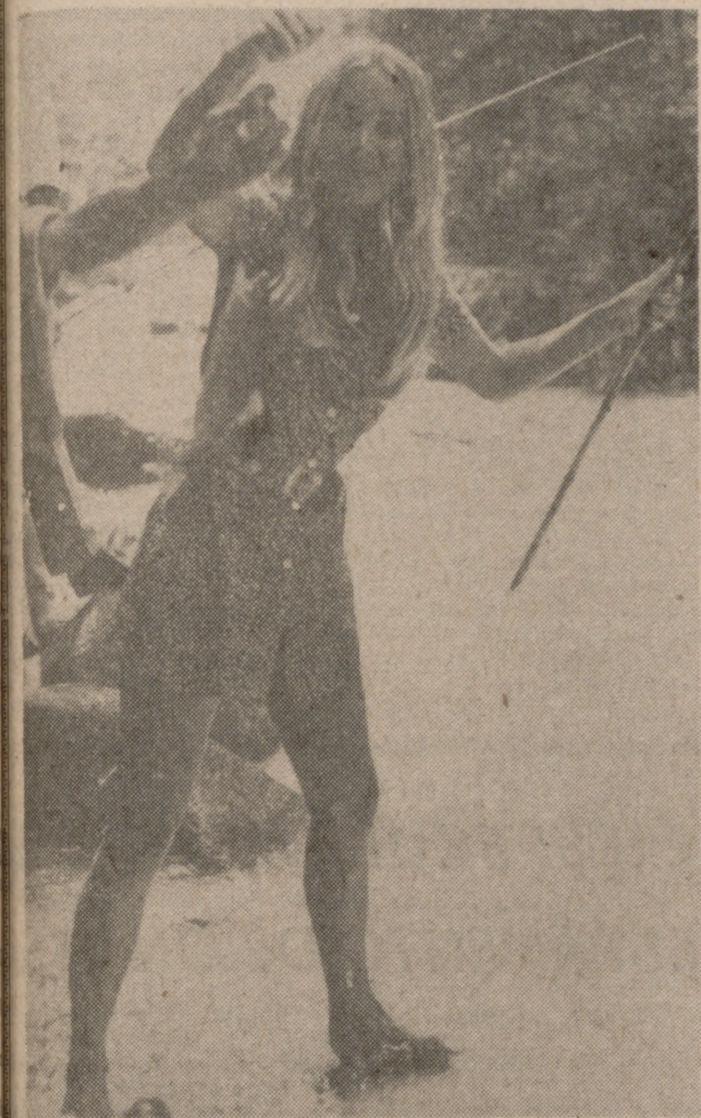
Cuando sus múltiples actividades cinematográficas se lo permiten, Bárbara Bouchet, la bella actriz, pasa su tiempo libre a orillas de un río, como en la foto, o en una costa cualquiera con una caña de pescar en la mano, a la espera de que los mejores peces se decidan a picar. Esta afición le sirve sin duda a Bárbara Bouchet para relajar sus nervios, a menudo destrozados en las frenéticas actividades cinematográficas.