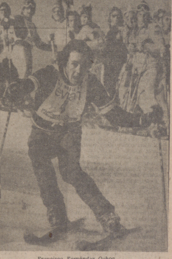
Francisco Fernández Ochoa.