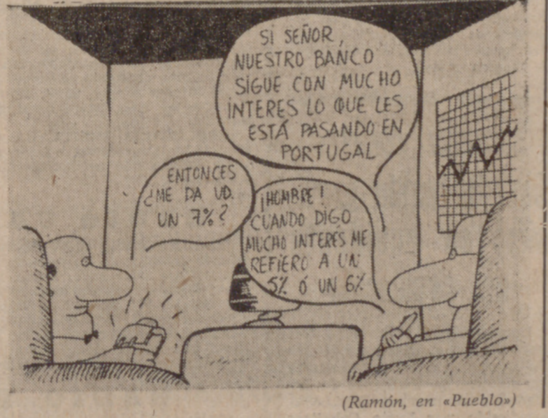
(Ramón, en "Pueblo")

Parafraseando a Arquímides, bien puede afirmarse ahora que ya no basta la posesión de una palanca y de un punto de apoyo para revolucionar al mundo, porque es suficiente un motor y su combustible correspondiente para obtener resultados más contundentes y positivos. Y lo hemos visto bien a nuestra costa.