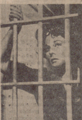
El pasado sábado los tipos difundieron la noticia: Susan Hayward, la actriz que tanta gloria había dado al séptimo Arte, falleció a los cincuenta y seis años de edad en Beverly Hills (California). En la fotografía, un fotograma de uno de los mayores éxitos de la actriz, que, ahora, con su muerte, ha conternado a todo el mundo. «Quiero vivir», en la que obtuvo un Oscar de interpretación.