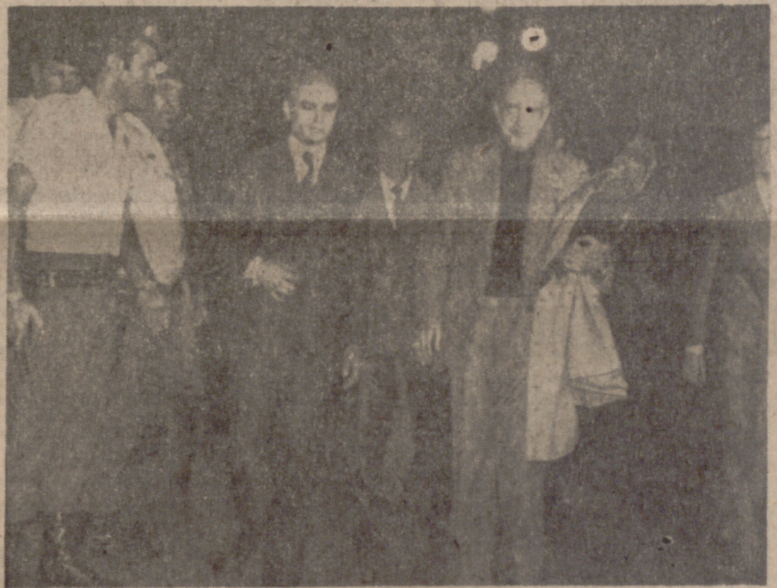
SAO PAULO.—El ex Presidente de Portugal, Antonio Spínola, llega al Hotel «Jaragua» de Sao Paulo acompañado de los dieciséis portugueses que abandonaron junto a él su país.

BRASILIA, 17. (Efe).— El embajador de Portugal en Brasil, Vasco Futscher Pereira, después de varios días de permanencia en Rio de Janeiro, regresó el sábado a esta capital, pero durante toda la jornada evitó contactos con los periodistas. Además de las condiciones implícitas en la concesión del asilo político, según las cuales se prohíbe la manifestación de actos que puedan afectar a las relaciones de Brasil con otros países, el general Antonio Spínola y los militares que le acompañan tienen la advertencia del Gobierno brasileño, hecho ya hace tres semanas, de que no se permitirá ninguna clase de manifestaciones relacionadas con Portugal. A finales del pasado mes de febrero, las autoridades brasileñas dieron a conocer un comunicado en el que se recordaba que tales manifestaciones o actos están prohibidos desde el año 1969, por un decreto, y se refería a recientes manifestaciones de elementos de la colonia portuguesa radicada en el país. Este decreto ley prohíbe toda y cualquier manifestación de extranjeros residentes en Brasil, aunque sea realizada entre compatriotas y estén relacionadas únicamente con sucesos del país de origen. NO PODRAN RETRANSMITIR LA MISA LISBOA, 17. (Efe).—Radio Renacimiento, la emisora radiofónica católica, ha anunciado que las autoridades le han prohibido la retransmisión semanal habitual de la santa misa, según informa la agencia «Associated Press».