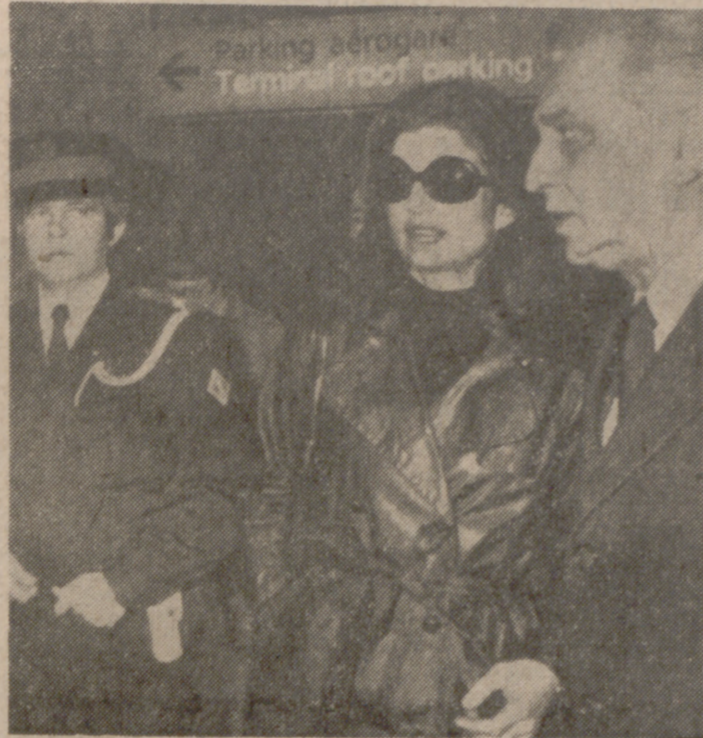
PARIS.—Jacqueline Onassis a su llegada ayer al aeropuerto «Charles de Gaulle», procedente de Nueva York.

Los cuatro niños, de edades entre diecinueve meses y cinco años, murieron en circunstancias misteriosas el lunes pasado. Cuando su madre regresó del trabajo a su casa, en el barrio de Greenwich, encontró los cuerpos sin vida. Las autopsias confirmaron que los cuatro murieron a causa de recibir docenas de navajazos cada uno.