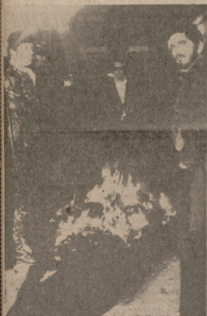
LISBOA.—Una hoguera fue provocada ante la residencia del general Antonio de Spínola, con sus libros y documentos personales, por los manifestantes que la atacaron. Como se sabe, Spínola es uno de los 27 oficiales implicados en el fracasado golpe de Estado, según declaraciones del Presidente Costa Gomes.

BADAJOS, 13. (PYRESA). Parece que el general Antonio de Spínola y los oficiales que le acompañaron en su salida de Portugal, permanecen en la Base Aérea de Reato, en la Base Aérea de Talavera la Real. Ayer circuló el rumor de que los militares portugueses se habían trasladado a Trujillo, pero el Alcalde de dicha localidad ha manifestado que no tiene noticia de ese traslado y que si hubiesen llegado a Trujillo, él lo sabría, lógicamente.