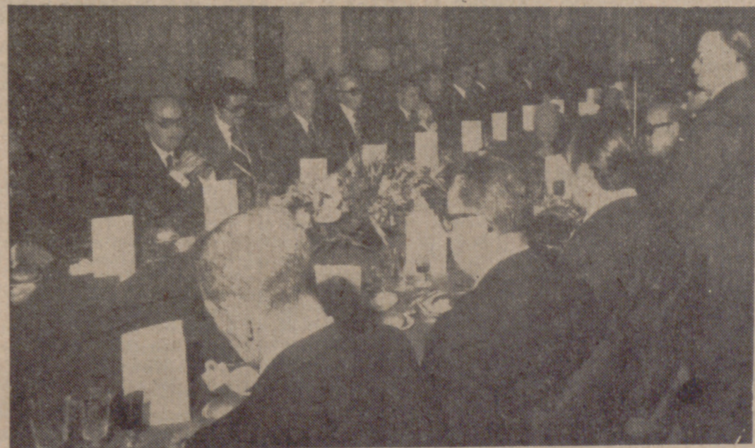
LAS PALMAS.—Con motivo de la estancia del Presidente del Ecuador, general Guillermo Rodríguez de Lara, en esta capital, acompañado de dos ministros de su Gobierno y de otras personalidades, se han celebrado unas conversaciones hispano-ecuatorianas, en las que la delegación española estaba presidida por el Ministro de Comercio, señor Cerón, y la ecuatoriana por los ministros de Recursos Naturales y de Finanzas.