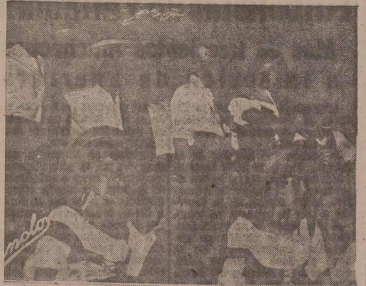
Un momento de la representación de la obra "El rey que rabió", por nuestra agrupación lírica los "Amigos de la Zarzuela", en la capital de Palencia, en donde han obtenido un señalado éxito de crítica y público.