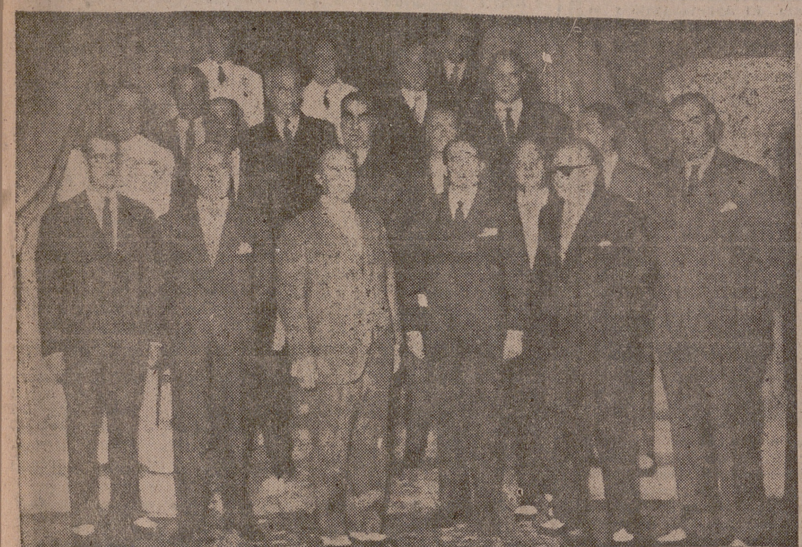
La Coruña.—S. E. el Jefe del Estado, acompañado de los ministros del Gobierno, momentos antes de dar comienzo el Consejo celebrado en el Pazo de Meiras.

CONSEJO DE MINISTROS EN EL PAZO DE MEIRAS