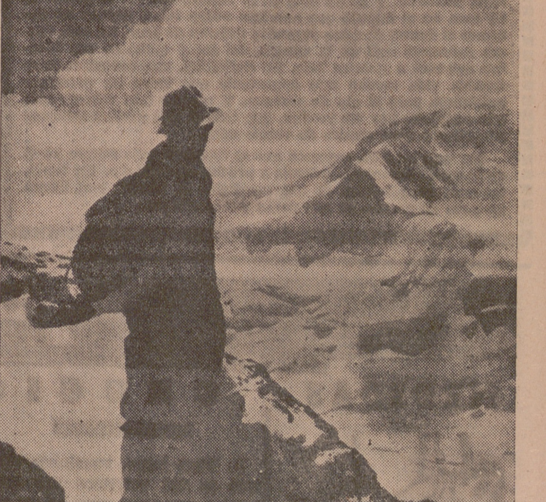
En fin, ha yaficiones cuyo principal encanto radica en no poderlas explicar racionalmente, y tal vez sean las que más enamoran y aun esclavizan.

No hace muchos años, los fanáticos de la Naturaleza podían decir que practicaban el "alpinismo"—en los Alpes parece ser que nació el deporte de "escalar"—por el placer de recrear la vista y el espíritu en los extensos panoramas que solamente se descubren desde las grandes alturas; los picos destacados de la cresta serena; más incitante cuanto más difícil de escalar. Y los considerados inacesibles despertaban en los experimentados montañeros ambiciones intrépidas y heroicas—a lo Pizarro y Hernán Cortés—, aunque inútiles. El propio Don Quijote, tan cumplido paladin de las ilusiones, si anduvo por Sierra Morena a zapaterías y calabazadas, sufriendo las inclemencias del cielo y las asperezas de la tierra desnuda y descalzo, no fue por afición deportiva, sino emulando la propiciatoria penitencia de Bel-tenebros, y le confesó a Sancho que eran locuras de amor adolorido y errático. No era absurdo ni malo el gusto de descubrir panoramas