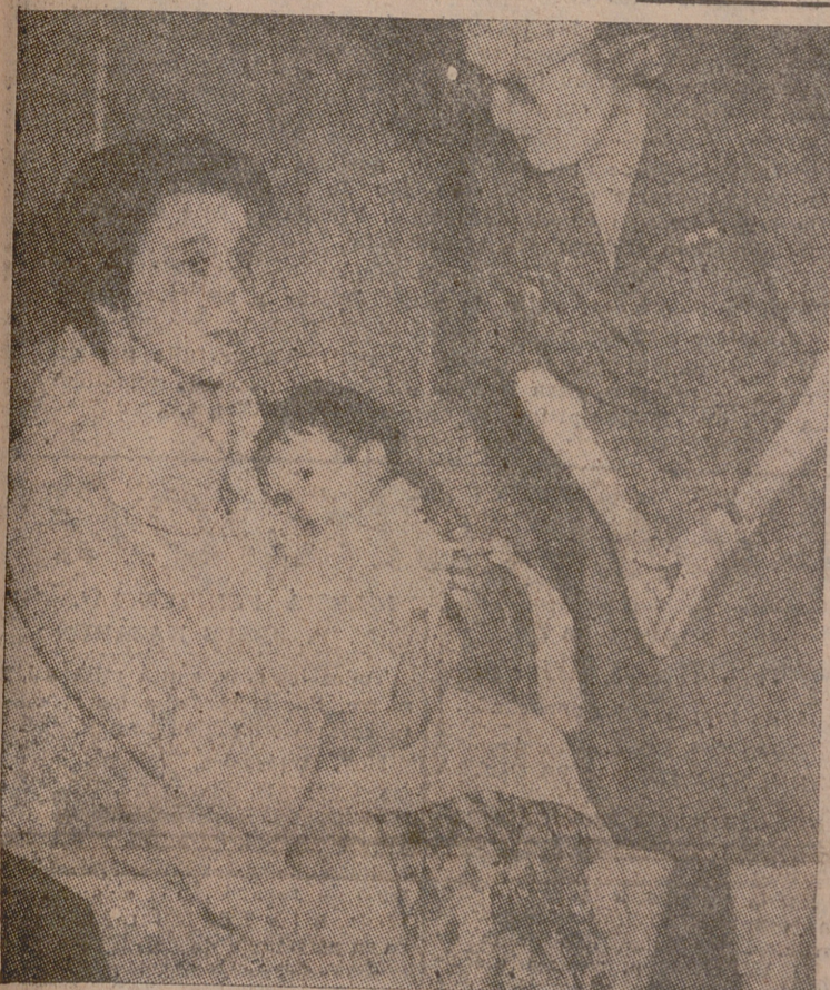
Esta joven madre acaba de llegar al aeródromo de Orly, entre las primeras francesas autorizadas a abandonar Túnez. No tiene parientes ni conocidos en Francia. Están solos ella y su hijo de nueve meses.