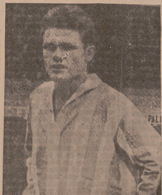
Pero antes de entrar en esta materia, Molina se adelanta para hacer un canto a Valladolid:

—Llevo más de un mes y tanto mi señora como yo estamos encantados. Allí, en Barcelona, nos habían informado erróneamente; nos lo pintaron todo tan negro que luego la sorpresa ha sido más agradable.