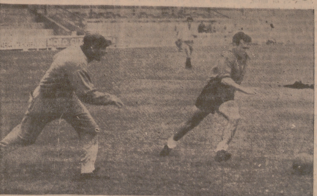
Ayer se reanudaron los entrenamientos del Real Valladolid. Los jugadores empiezan a echar fuera la grasa acumulada durante el verano y desde el sábado entrenan ya con balón. Esta mañana, temprano para evitar el calor, celebraron una sesión normal e incluso un partido, del que Carvajal ha captado una instantánea.