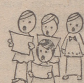
Choir boys «kuaiar bois»