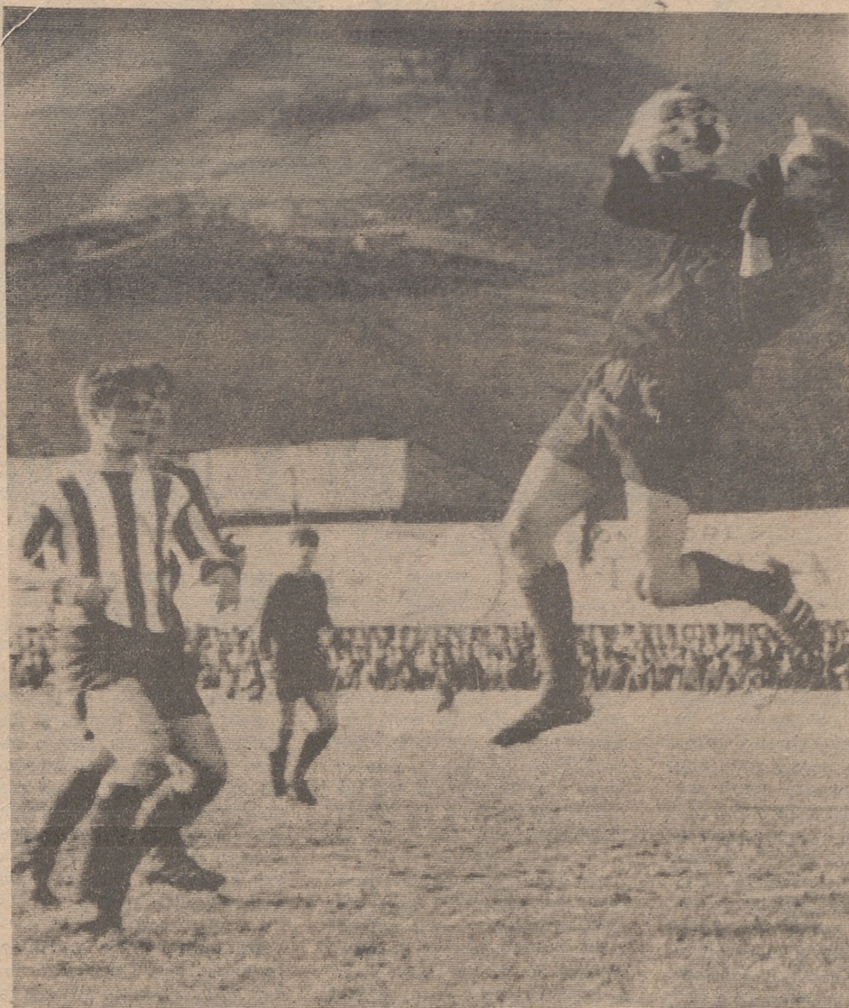
El meta eibarrés bloca el balón ante el acoso de Guesalaga.