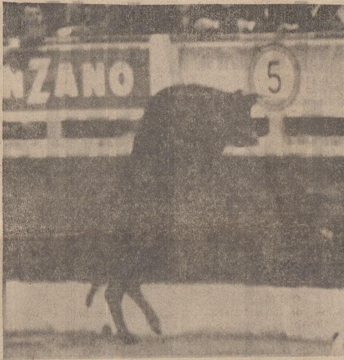
El sustituto del cuarto novillo intenta saltar al callejón.

También con el pincho anda «verderón». Al que cerró plaza lo mechó materialmente antes de que sonaran dos