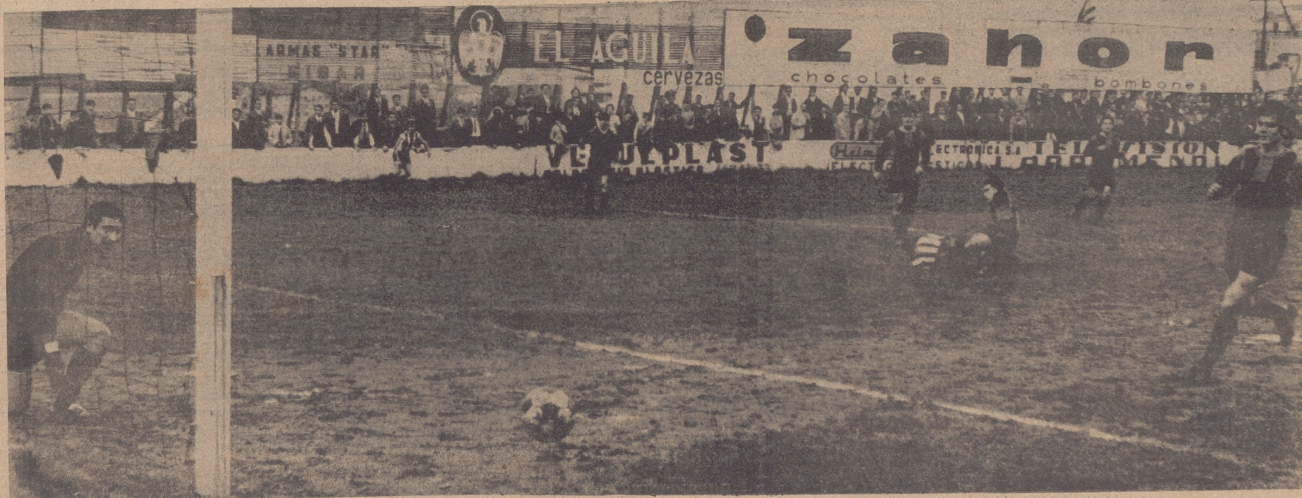
Murgulondo, cogido a contrapé por el disparo de un delantero blanquirrojo, observa con cara de susto cómo el balón sale fuera por poco.