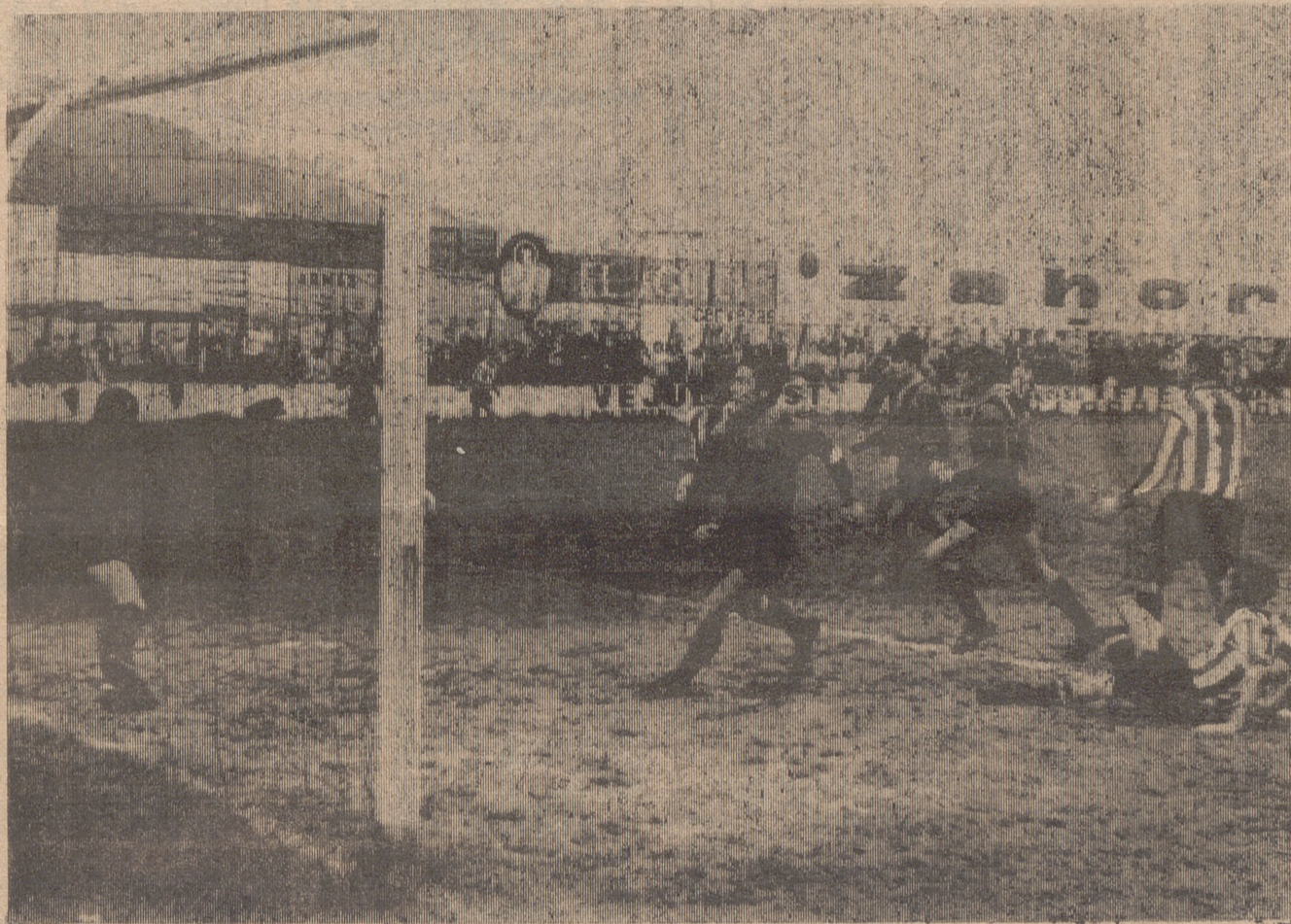
Eran los primeros quince minutos de juego. El balón ronda los dominios de Murgulondo.