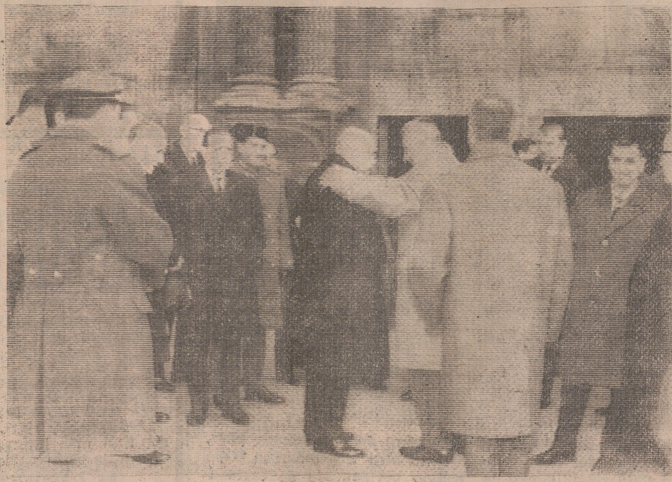
Las autoridades en el momento de entrar en la misa conmemorativa del XXV aniversario del Frente de Juventudes.—(Foto "Albe").

El domingo, a las diez y media de la mañana, se celebró en el Real la misa de acción de gracias con motivo de cumplirse el XXV aniversario de la Ley Fundacional del Frente de