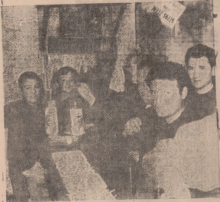
Si siguiendo su tradicional costumbre de muchísimos años, «Los Amigos del Sanatorio de San Pedro» continúan su «Operación Calderilla», dando un ejemplo permanente de caridad bien entendida.