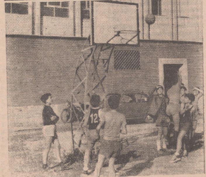
El programa deportivo se cumplió en todas sus partes con extraordinaria animación. Las fotos de "Albe" recogen dos momentos del tiro con arco y basket-ball, respectivamente, en el bonito escenario de las instalaciones juveniles.

El Calahorra brilló con fuerza propia en la ratonera de Rentería, de donde, con un equipo arbitral neutral, posiblemente hubiera regresado en vencedor sin mácula. Porque el Calahorra arrojó materialmente a su contrario y dio una auténtica lección de bien hacer en el embarrado terreno de los galleteros, a los que superaron los rojillos en todo momento.