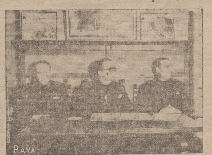
LA PRESIDENCIA, EN LA CLAUSURA DEL CONSEJO, MIENTRAS SE LEEN LAS CONCLUSIONES.

Examen crítico del plan de formación de las Falanges Juveniles de Franco.—El estudio de este tema abarcó el examen del plan actual y la formación de mandos locales afines a los fines de servicios provinciales. Coordinación de actividades entre fieles, cadetes y guías. Posibilidades de realizar actividades