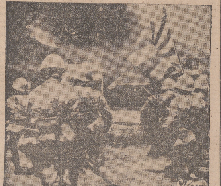
UN EPISODIO DE LA CAMPAÑA MILITAR INICIADA POR TOJO Y QUE FUE EL PRELUDIO DE LA GUERRA CHINO-JAPONESA.