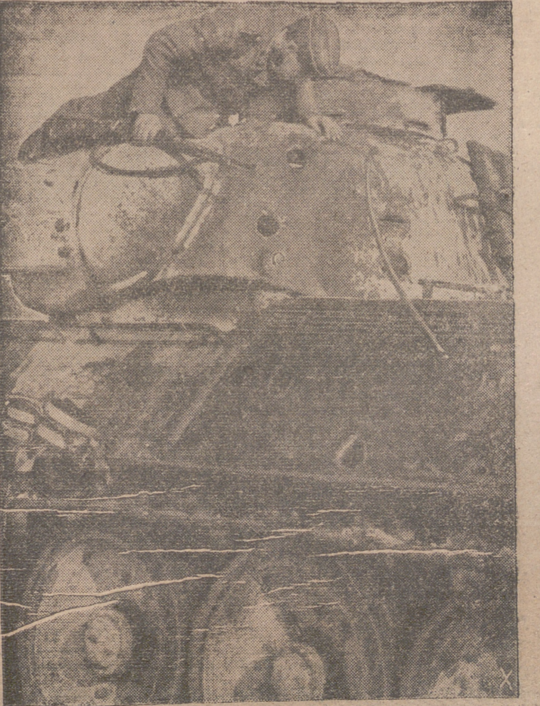
Sobre este tanque soviético T 34 pueden apreciarse claramente los impactos de las granadas antitanques alemanas.