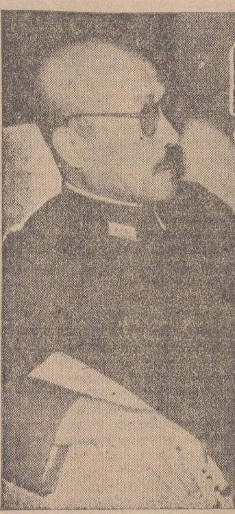
El general Tojo viste siempre un sencillo traje militar y rara vez aparece así sentado en una cómoda butaca.

«La figura de Tojo—dice el «Das Reich», hace tres años—impresiona por sus rasgos voluntariosos. Sus ojos vivaces se ocultan tras unas gruesas gafas con marco obscuro. La boca se pliega un poco bajo su ligero bigote. No es su fuerte la elocuencia; pero cuando algo la suzuga muy dentro del corazón, encuentra siempre las palabras persuasivas».