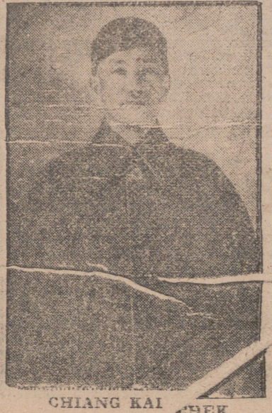
CHIANG KAI CHEK

lebró en una tienda de campaña al pie de las Pirámides.—(Efe.) NUEVA YORK.— La noticia de Lisboa, según la cual se han reunido en El Cairo, Churchill, Roosevelt y Chiang Kai Chek, es objeto de grandes titulares en todos los diarios de la noche. "New York Post", en particular, la titula a toda plana, por supuesto, la primera. La noticia fué recibida demasiado tarde para que haya podido comentarse en los editoriales.—(Efe.)