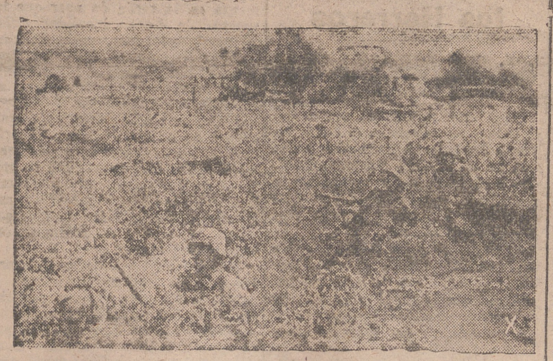
Infantería alemana se dedica al contraataque en el dispositivo defensivo del Dnieper.