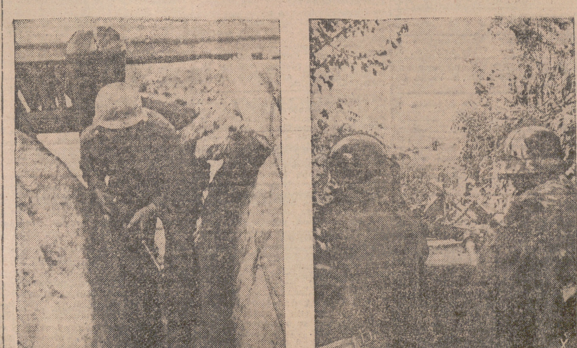
SOLDADOS ALEMANES EN SUS PUESTOS DE OBSERVACION Y DE ESCUCHA EN EL FRENTE SOVIETICO.