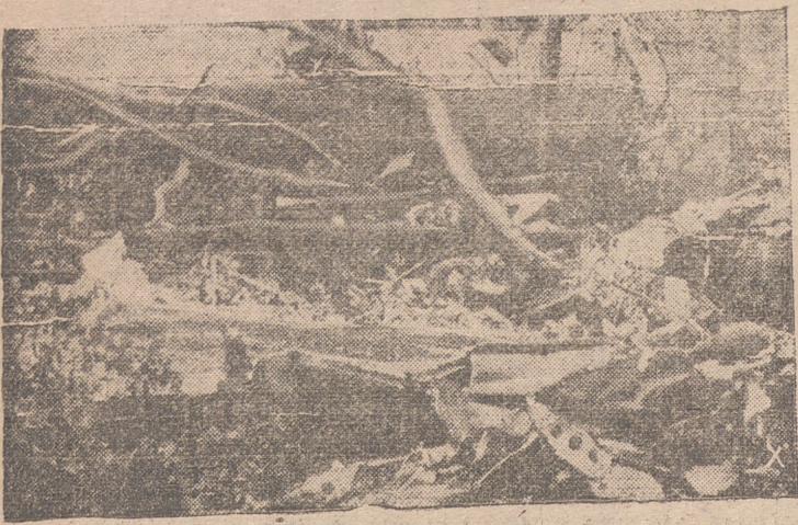
Cada vez está más perfeccionado el sistema de defensa antiáerea. Aquí pueden verse los restos de uno de los 45 bombarderos aliados derribados en una de las últimas incursiones sobre el Oeste de Alemania.