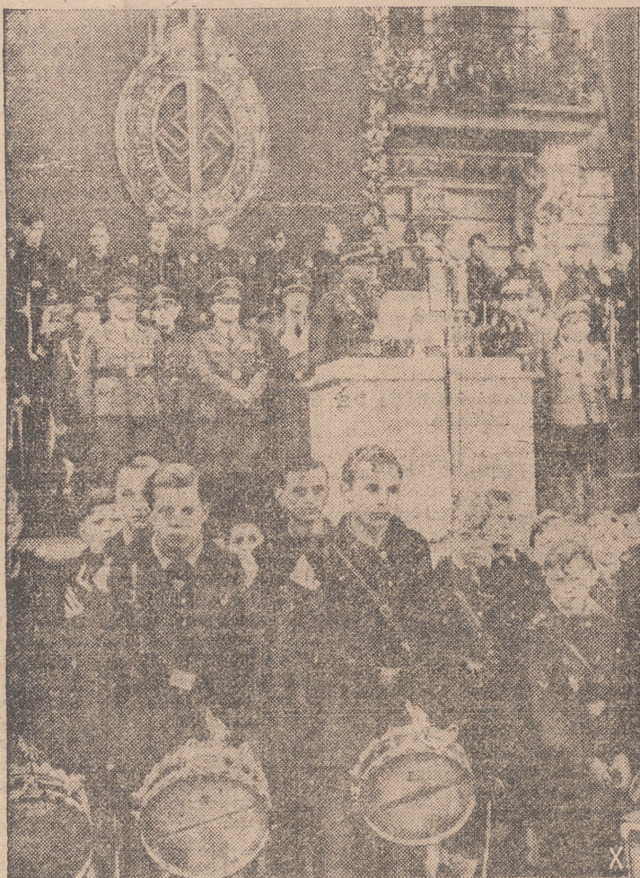
En Koburg, con motivo de XXI aniversario de la gran manifestación nacionalsocialista, se ha celebrado una concentración de las Juventudes Hitlerianas, a las que dirige la palabra el jefe de las fuerzas de asalto del partido, Sch eppmann.