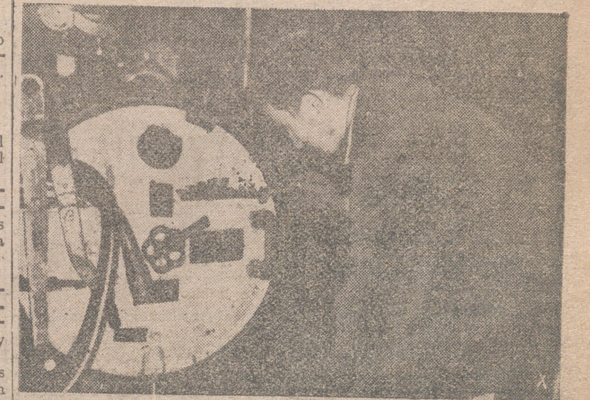
Las posiciones soviéticas del Lago Ilmen fueron protegidas con lanzallamas que se encendían a distancia. Un miembro de las S. S. alemanas elimina el peligro lanzando los lanzallamas.