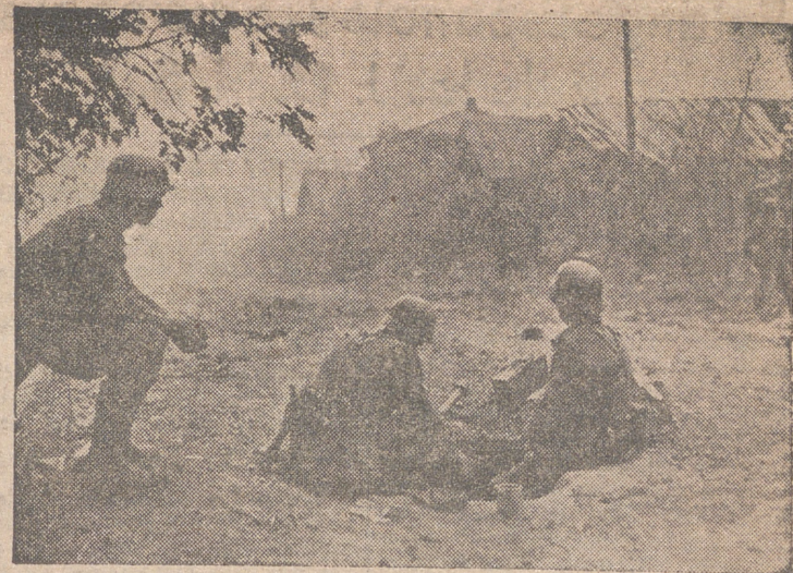
Aparentemente todo está en calma. Sin embargo, los soldados alemanes no abandonan un momento la vigilancia en el poblado recién ocupado.