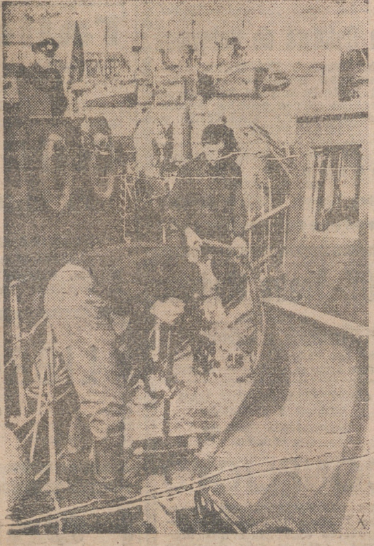
El buque rastreador alemán ha regresado a su puerto. La tripulación lava cuidadosamente la cubierta antes de preparar el barco para nuevos servicios.