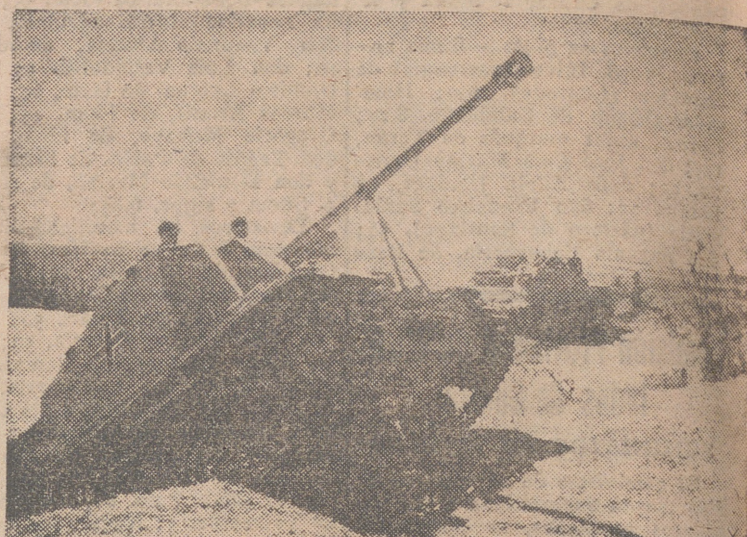
Uno de los más recientes modelos de tanque alemán, que ya opera con gran eficacia en el sector de Orel.