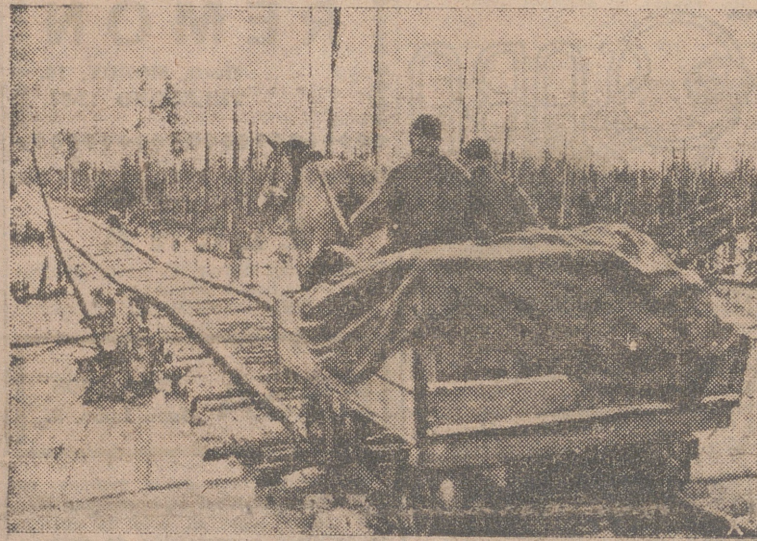
Ha sido totalmente construido con material de los grandes bosques ruinosos y forma una vía de comunicación cómoda y fácilmente reparable entre la línea principal de combate y los campos de aprovisionamiento.