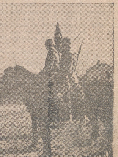
El jefe de una unidad de caballería rumana pasa revista a sus fuerzas en un sber del campo.