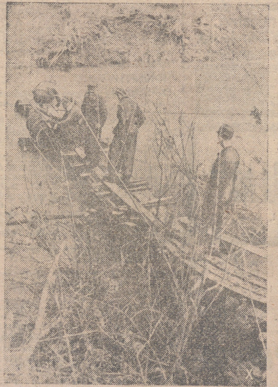
Para que los puestos avanzados puedan alcanzar más rápidamente la tierra de nadie, los zapadores alemanes construyen con toda celeridad esta pasarela flotante.