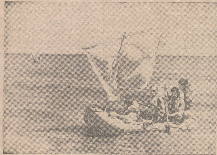
En el Mediterráneo aprieta el calor. Los soldados libres de servicio lo combaten haciendo pequeñas excursiones en marinas, para las que utilizan los botes neumáticos.