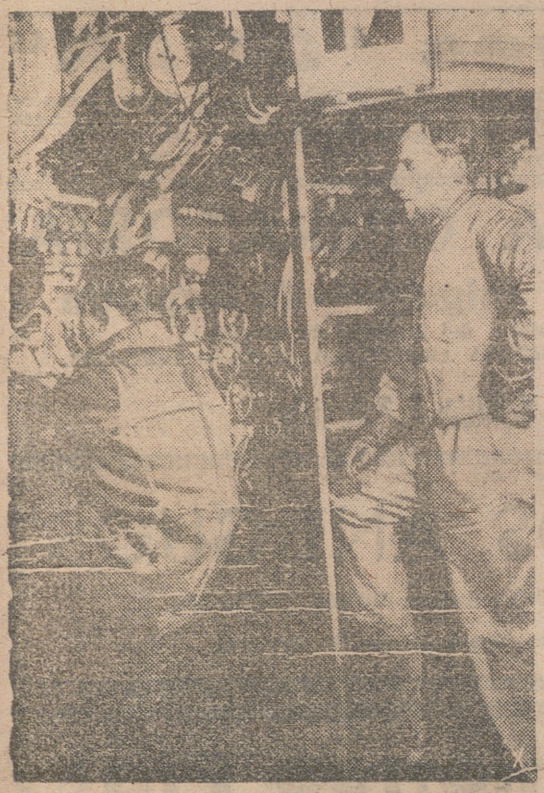
Próximo a la costa americana, el submarino alemán ha hecho una inmersión para no ser visible. En el grabado se ve a los sirvientes del timón de profundidad.