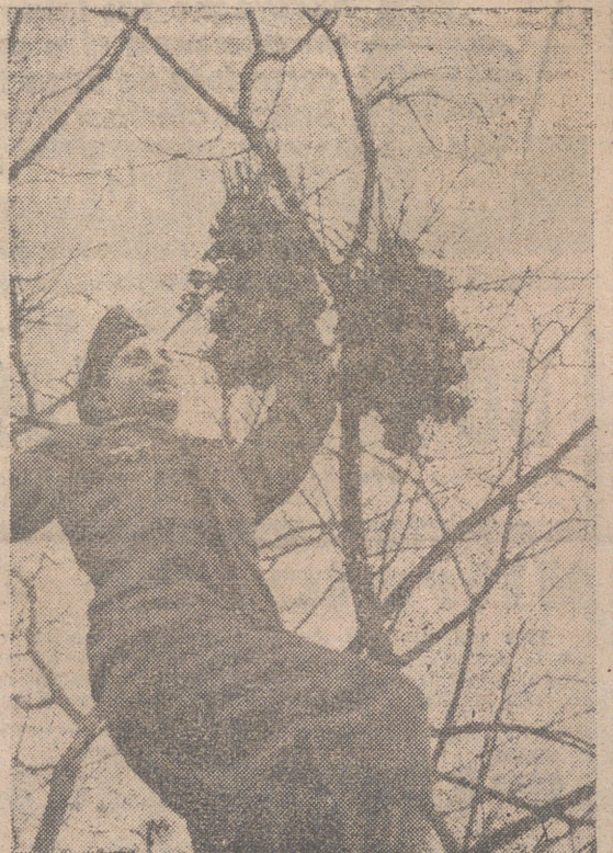
Este soldado alemán de la artillería antiaérea, trepa todos los días a lo alto de los árboles donde cuelga manojos de hierbas para alimento de los pajarillos cañío. (Foto Orbis).