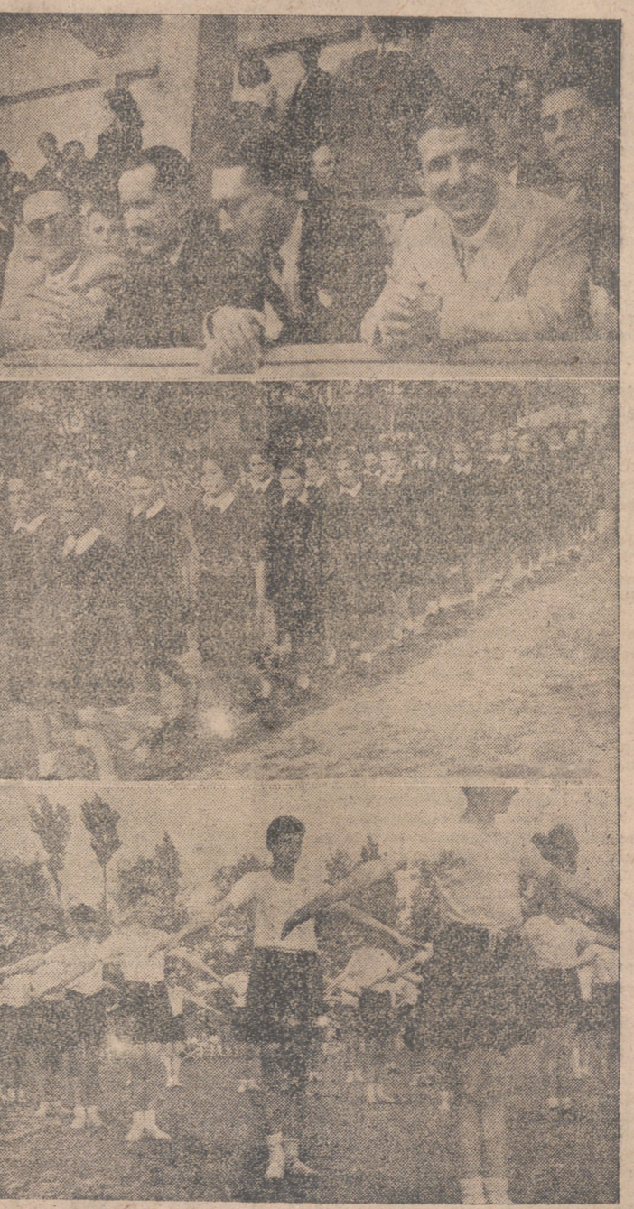
DIVERSOS MOMENTOS DE LOS ACTOS CELEBRADOS EL PASADO DOMINGO EN NUESTRA CAPITAL CON MOTIVO DEL "DÍA DE LA JUVENTUD"