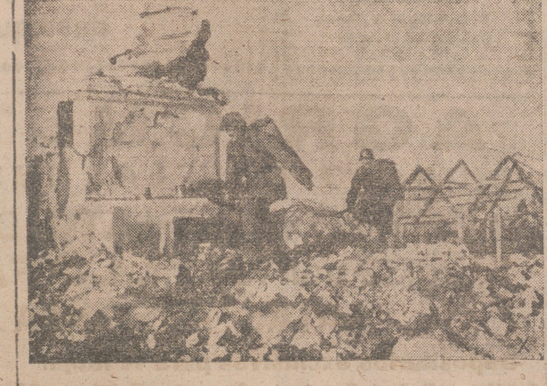
Rechazado, como tantos otros, el ataque lanzado por los bolcheviques. Los soldados alemanes salen de entre las ruinas que les han servido de parapeto para emprender la persecución del enemigo en retirada.