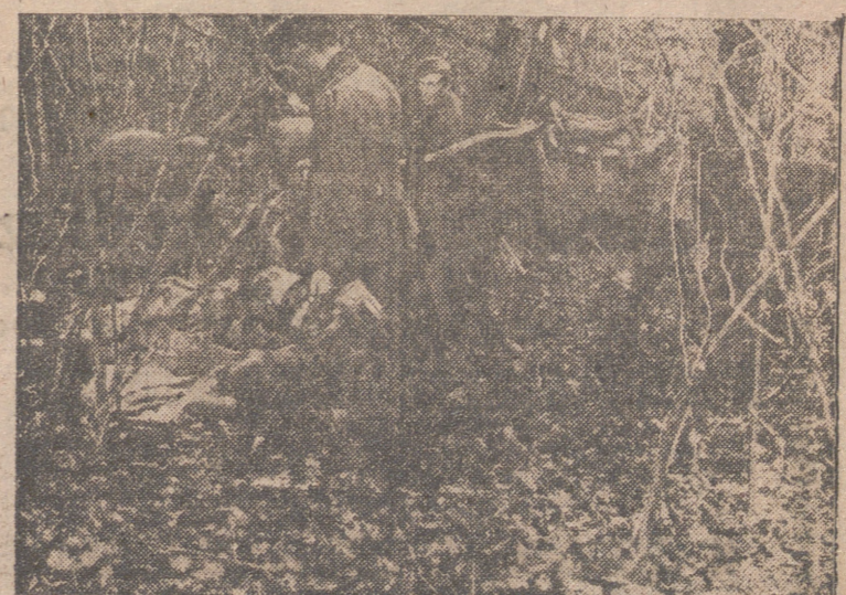
Cuando la naturaleza del terreno, como ocurre con este bosque, no permite el paso de las columnas motorizadas de aprovisionamiento, los viveros y municiones se hacen llegar hasta la línea de fuego transportados por animales de carga.