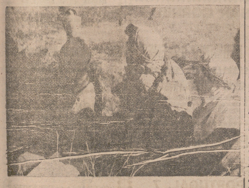
Desde las líneas alemanas se observa la presencia de numerosos tanques americanos. Algunos indígenas ayudan al jefe del destacamento de exploración a identificar las posiciones del enemigo.