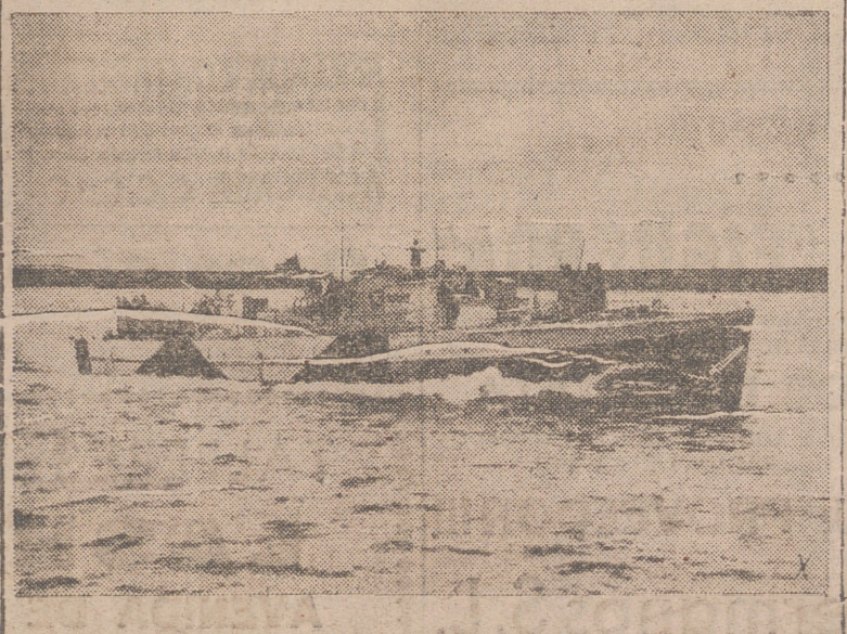
Una de las lanchas rápidas torpederas alemanas que operan en el Canal de la Mancha.