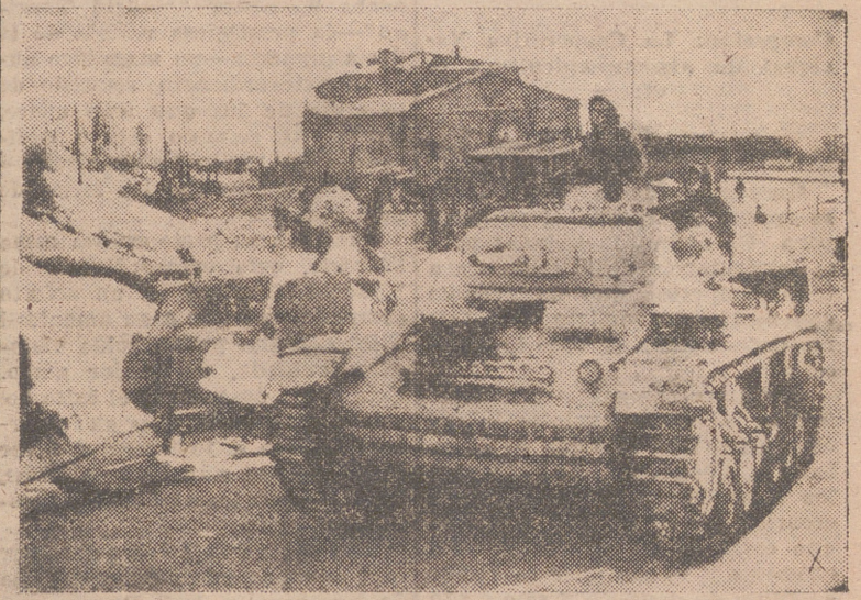
En las inmediaciones de un pueblo soviético se concentran los tanques alemanes antes de emprender el ataque.