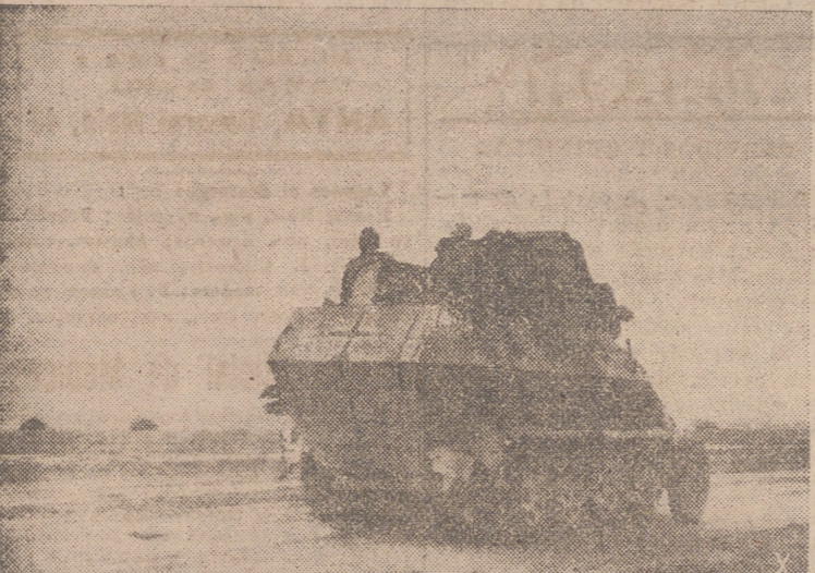
FUERZAS MOTORIZADAS ALEMANAS DE EXPLORACION INSPECCIONANDO EL TERRENO.