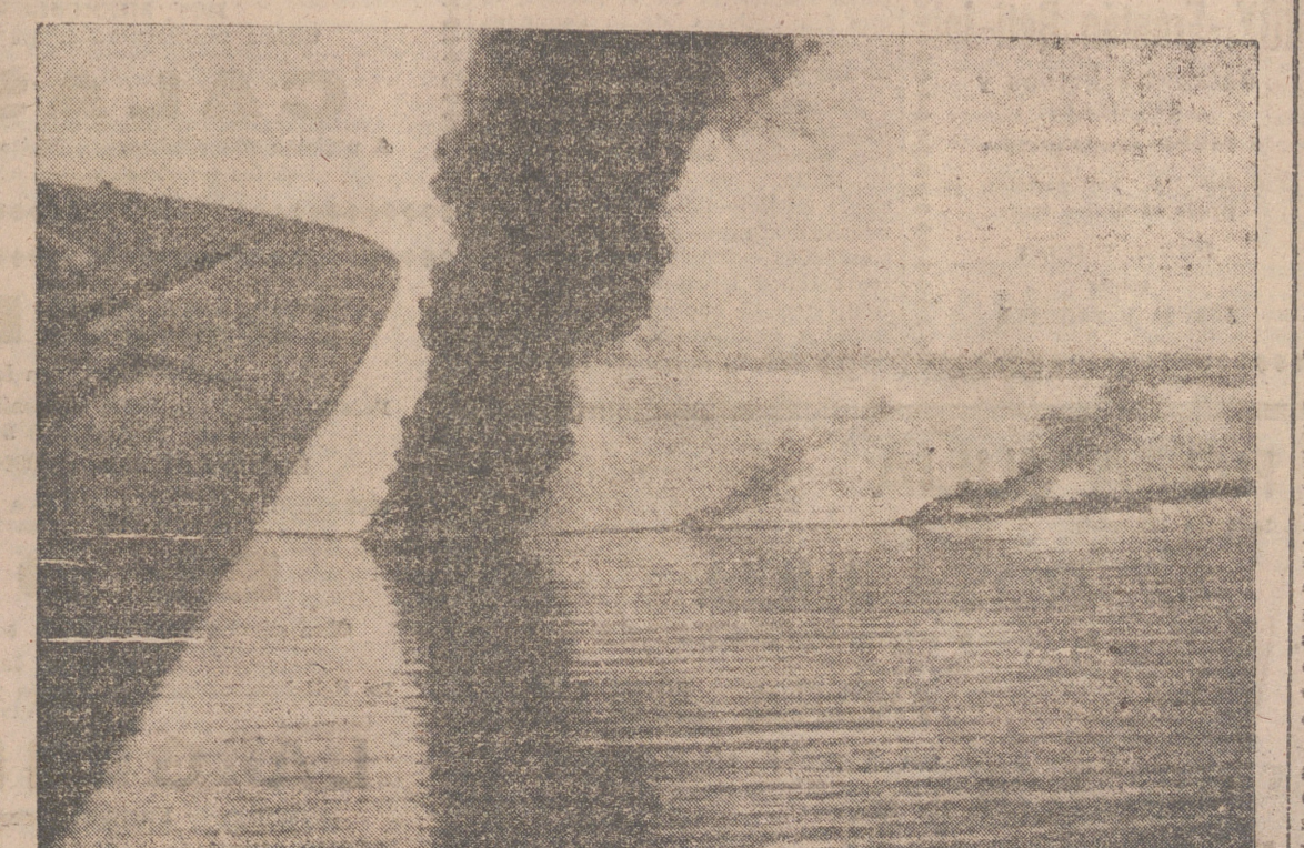
LOS AVIONES TORPEDEROS DEL EJE ATACAN UN CONVOY ENEMIGO EN LAS INMEDIACIONES DE BONA. POCO DESPUES, TRES PETROLEROS ARDEN, ALCANZADOS DE LLENO.