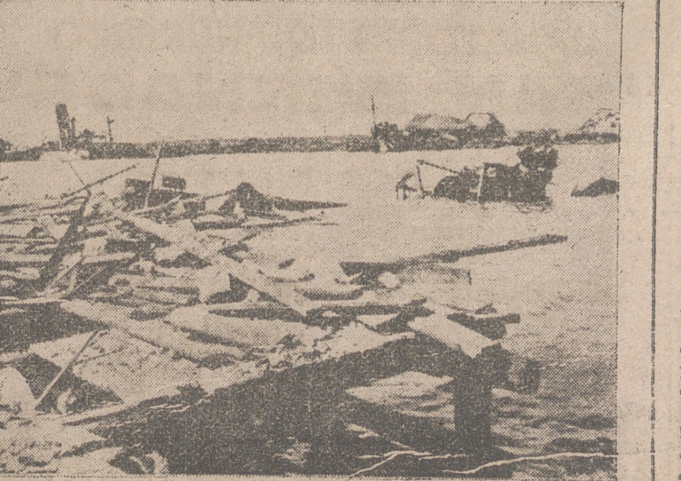
Buques soviéticos hundidos durante un ataque de los alemanes sobre uno de los puertos bolcheviques en el Mar Negro