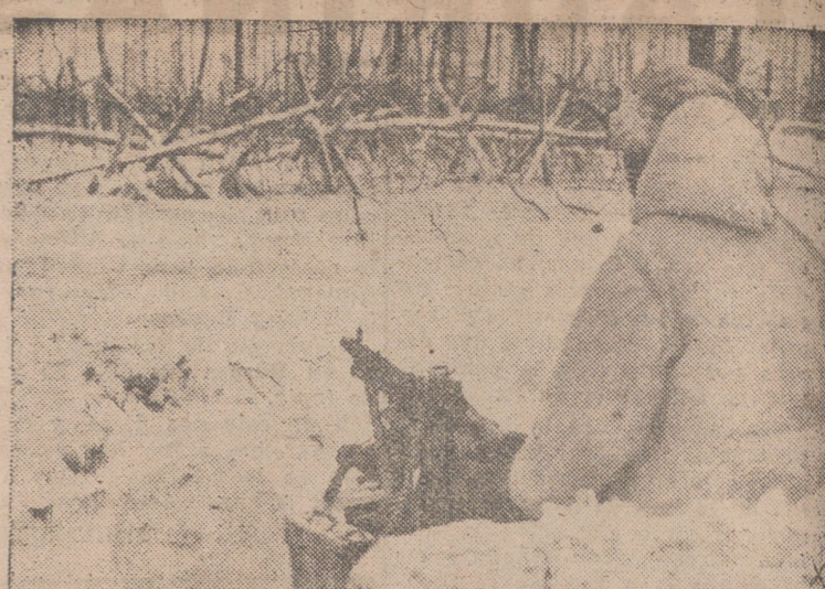
Puesto alemán de ametralladora en el lago de Ilmes.