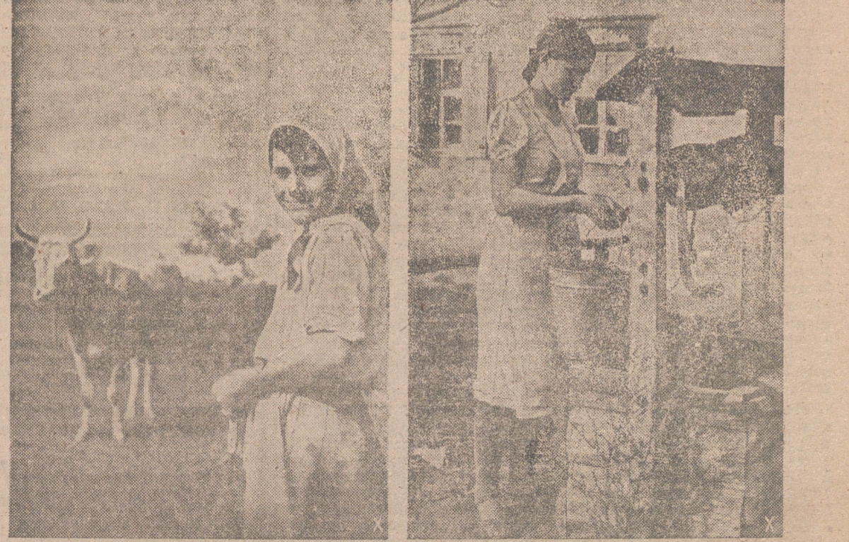
Estas muchachas campesinas de Ucrania se entregan con alegría a sus diarias ocupaciones, en franca cooperación con las autoridades alemanas de ocupación