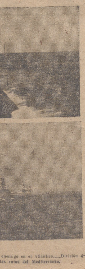
Un submarino torpedea a un mercante enemigo en el Atlántico.—División de cruceros pesados visitando las rutas del Mediterráneo.

El Gobierno, siguiendo la orientación de años anteriores, en su deseo de estimular el cultivo del trigo, cuya importancia, como producto básico en la alimentación, no es necesario ponderar, ha resuelto incrementar la cuantía de los primas a todos los que entreguen su trigo en la próxima cosecha para cupos a la Comisión de Abastecimientos con una cantidad que no será inferior a diez pesetas, ni superior a veintete, sobre el total importe pagado en el año actual y por todos conceptos a los productores de las distintas zonas. En el estudio general del problema el Gobierno entiende que el hecho, sensiblemente preñado de la disminución de la superficie dedicada al cultivo de trigo, es consecuencia, entre otras razones, de que existen cultivos o aprovechamientos, cuyo rendimiento económico resulta desproporcionado con relación al del cereal básico, y consecuentemente en su política de elevar, encareciéndole, el nivel de la vida, ha decidido gravar en forma justa y prudente los referidos cultivos o aprovechamientos más lucrativos para con el producto que se obtenga de todos los gravámenes allegar los fondos necesarios con que entregar a los cultivadores de trigo las expresadas bonificaciones compensadoras de los riesgos climatológicos, falta de fertilizantes, designando, en su lugar, agricultura, etc., que son cultivos de otras, originarias del menor rendimiento o tan importante cultivo. A tal efecto, y con la oportunidad que se estima necesario, se dictarán las medidas preventivas.