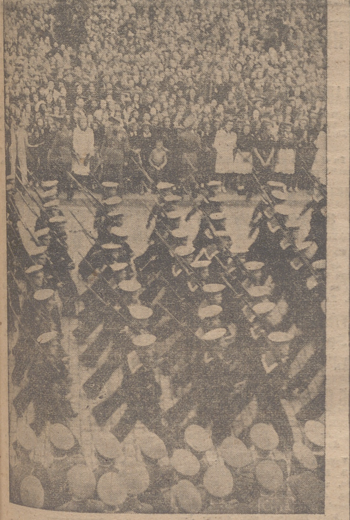
INFANTERIA DE MARINA EN EL DESFILE ANTE EL CAUDILLO.