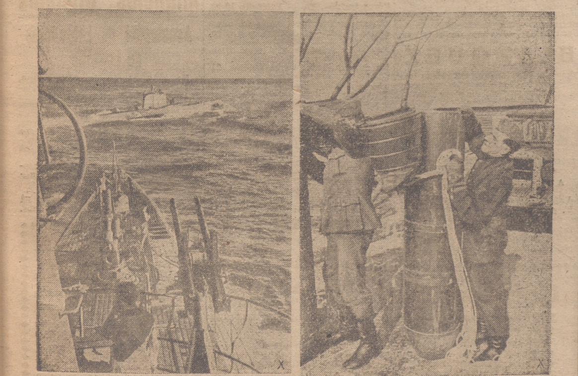
ENCUENTRO DELANTE DE LA COSTA AMERICANA.—Un submarino alemán y otro italiano se encuentran en la costa oriental americana. Después de un breve y cordial saludo de los comandantes los submarinos continúan su viaje para operar contra la navegación del enemigo.

contaban, cada una, con unos cien mil hombres, siendo los contingentes alemanes superiores a los cincuenta mil soldados de diferentes Armas. Teníamos superioridad en tanques—añade—en proporción de 7 a 5, aproximadamente, y en artillería de 8 piezas contra 5, comprendiendo varios grupos artilleros de "Howitzer" que disparan proyectiles de 25 kilos a 20 kilómetros de distancia. Inglaterra ha gozado, durante toda la batalla, y hoy goza aún de una superioridad aérea. Nuestra ofensiva podía haber comenzado a primeros de junio, pero se nos adelantó el enemigo. Cuando comprobamos que el enemigo se disponía a empezar las operaciones, decidimos esperar en nuestras posiciones fortificadas, y lanzarnos a un contraataque haciendo uso del máximo posible de fuerzas. Tal era la situación el día 26 de mayo, cuando Rommel comenzaba su ofensiva. Por ahora, ma es imposible dar cuenta exacta de la marcha de las operaciones, y todo lo que pudiera decir sería más fantástico que verosímil. Sin embargo, puede permitirse estimar que Rommel había contado con apoderarse de Tobruk en los primeros días de ofensiva, planeando una ofensiva, planeando una ofensiva, planeando una ofensiva... (Pasa a la cuarta plana)