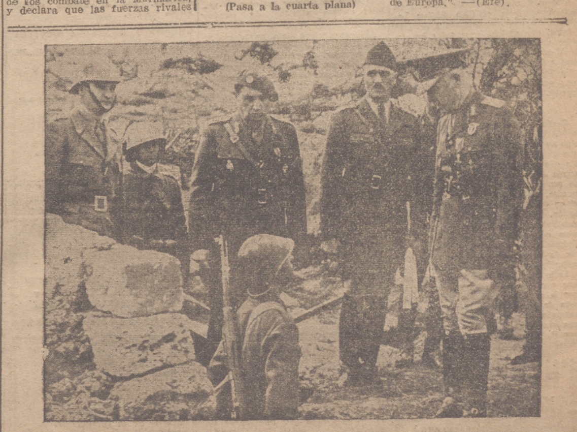
EL MARISCAL ANTONESCU VISITA UNAS POSICIONES RUMANAS EN EL FRENTE DEL ESTE

He aquí una de las bombas de madera que fueron lanzadas por los aviones soviéticos llenas de víveres y ropas de abrigo con destino a sus tropas cercadas, pero que han caído en poder de los alemanes.