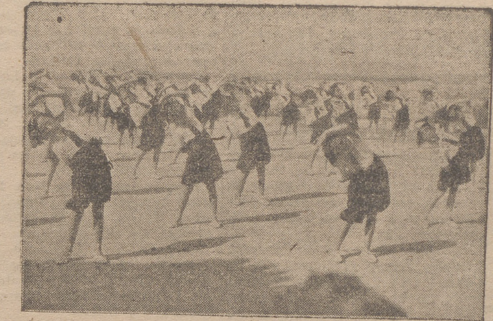
POR LA MAÑANA, TEMPRANO, EJERCICIOS DE EDUCACION FISICA

¿Cómo se ha organizado cada expedición y cuál será la vida en los Campamentos? Y estas son las respuestas, lector: En los Campamentos Femeninos se atenderá a la formación de las jóvenes y su vida será una continuación del hogar. Las niñas irán agrupadas por edades, de 11 a 14 años y de 14 a 17, no mezclándose unas con otras. Antes de ingresar en los Campamentos, cada niña habrá llenado una ficha médica en la que el doctor dictaminará que no tiene ninguna enfermedad contagiosa y que le es beneficiosa la estancia en el campamento. La solicitud habrá de ir firmada por los padres o tutores.