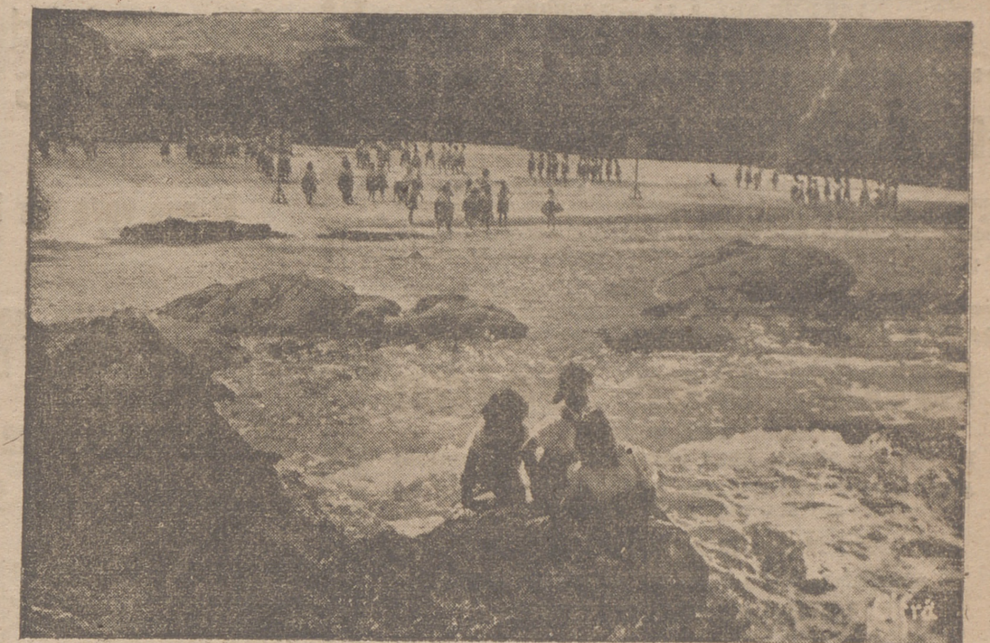
EN LA PLAYA

(Reportaje de CIFRA en la tercera página)