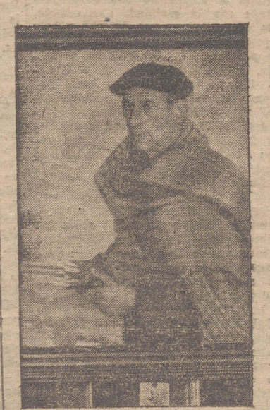
"Campesino", de Gerardo Sacristán, que figura en la Exposición de Educación y Descanso.

Fuera de concurso, figuran cuatro cuadros al óleo de Gerardo Sacristán, tres de Francisco R. Garrido, y otros tres de Jesús Lozano, tres firmas bien conocidas y justamente prestigias. En las del primer cuadro destaca la obra titulada "Campesino", perfecta de expresión y colorido; en las del segundo, el magnífico retrato del Caudillo que ha hecho, por encargo del excelentísimo Ayuntamiento de Logroño, y entre las del tercero un bello paisaje de Viana. Figuran también en la Exposi-