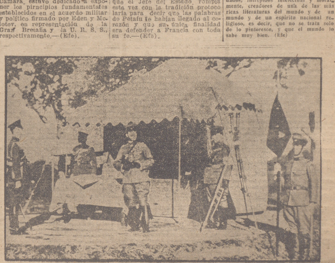
EL EMPERADOR JAPONES EN SU CUARTEL GENERAL