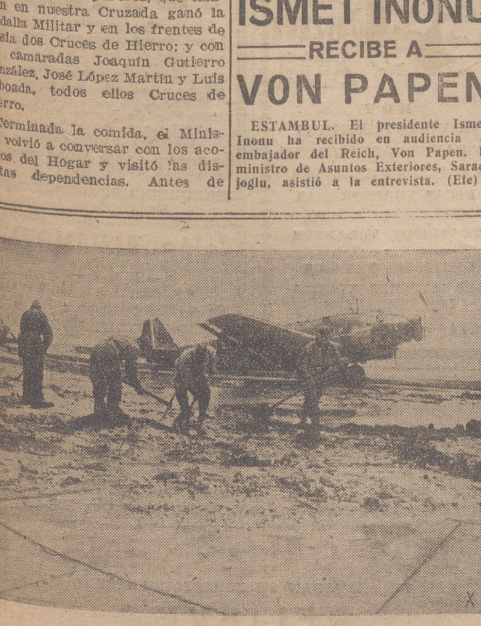
El personal de tierra de un aeródromo alemán en Rusia prepara la pista de despegue embarrada por el deshielo, para que puedan salir los aparatos.