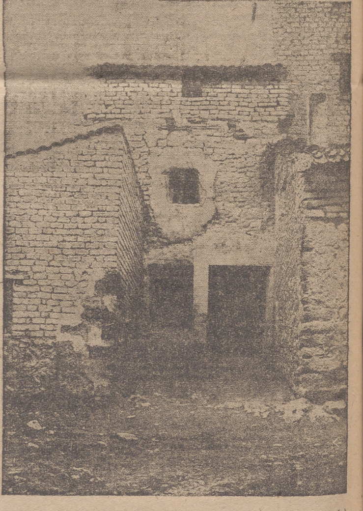
VIVIENDAS RURALES QUE HAY QUE DESTRUIR EN LA NUEVA ESPAÑA