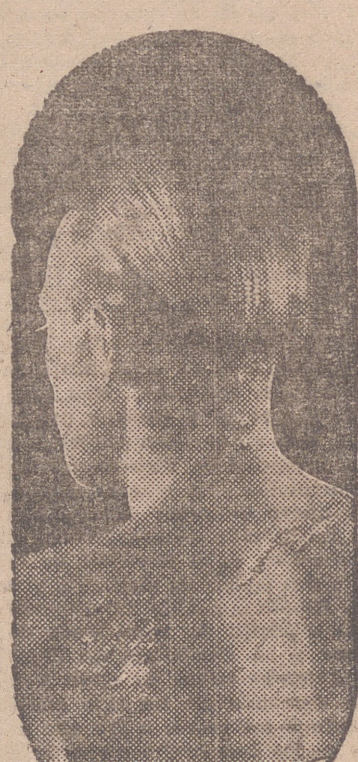
El eczema, herpes, psoriasis, etc., son manifestaciones de una sangre viciada que se debe purificar con el DEPURATIVO RICHELET

El Depurativo Richelet, es más que nada el "rectificador" por excelencia de la sangre viciada, ya que bajo su acción la masa sanguínea se purifica completamente. La sangre vuelve a