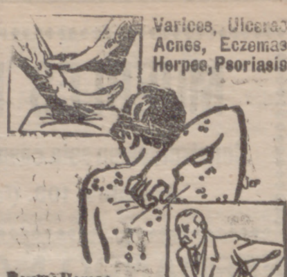
Varices, Ulceras, Acnes, Eczemas, Herpes, Psoriasis