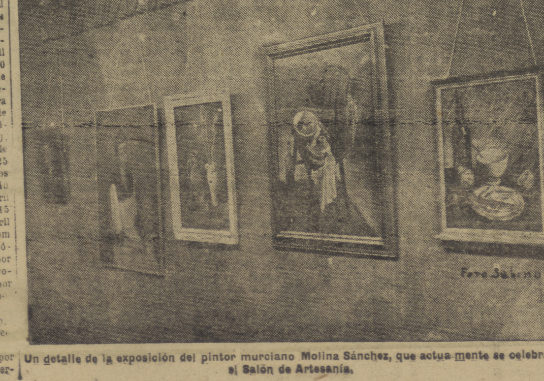
Un detalle de la exposición del pintor murciano Molina Sánchez, que actualmente se celebra en el Salón de Artesanía.