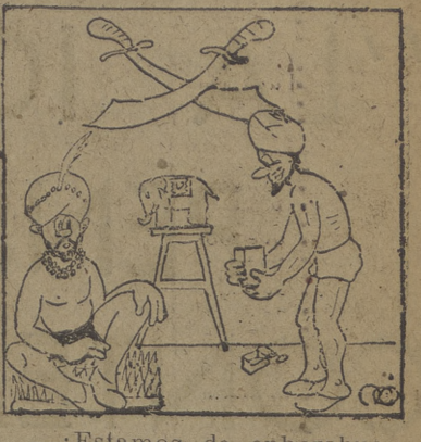
Estamos de enhorabuena! Hoy han dado de racionamiento puntos del 121