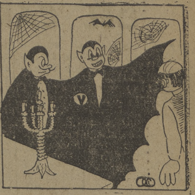
Baja a la bodega y tráete una botella de la mejor sangre que haya...