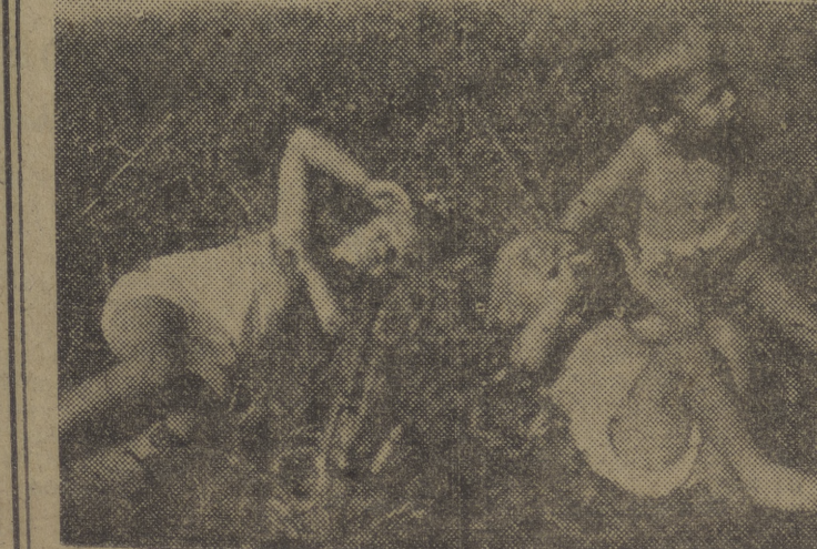
La Cruz roja suiza tiene instalada una escuela para niños europeos que han quedado sin familia durante la guerra.