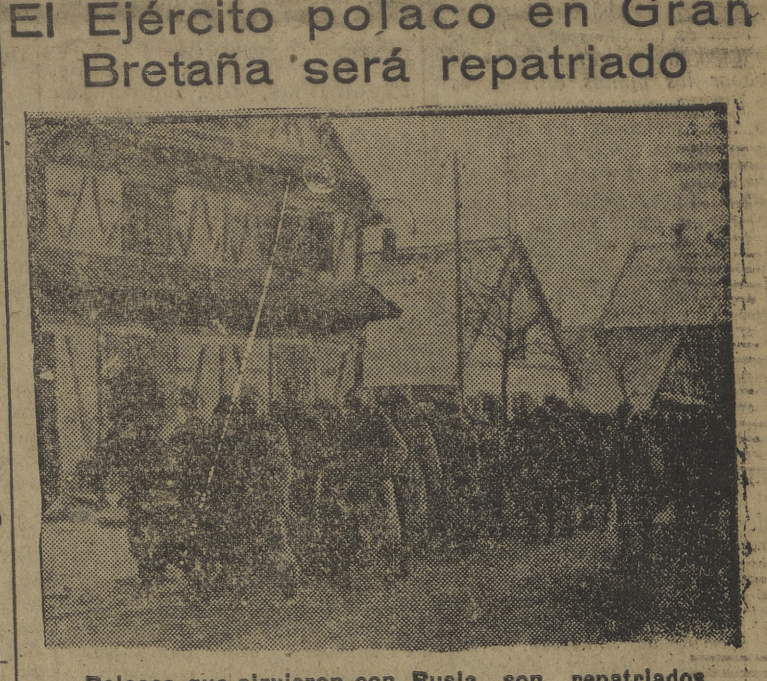
Polacos que sirvieron con Rusia son repatriados.

LAS IGLESIAS DE INGLATERRA HAN PROTESTADO ANTE ATTLEE, INTERCEDIENDO POR LOS GERMANOS EXILADOS El Ejército polaco en Gran Bretaña será repatriado