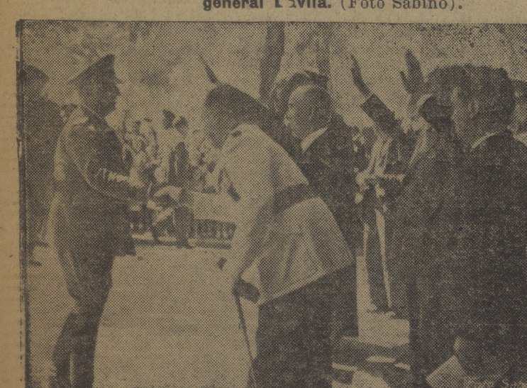
El Generalísimo, estrechando la mano del presidente de la Diputación y otras autoridades locales burgalesas. (Sabino).