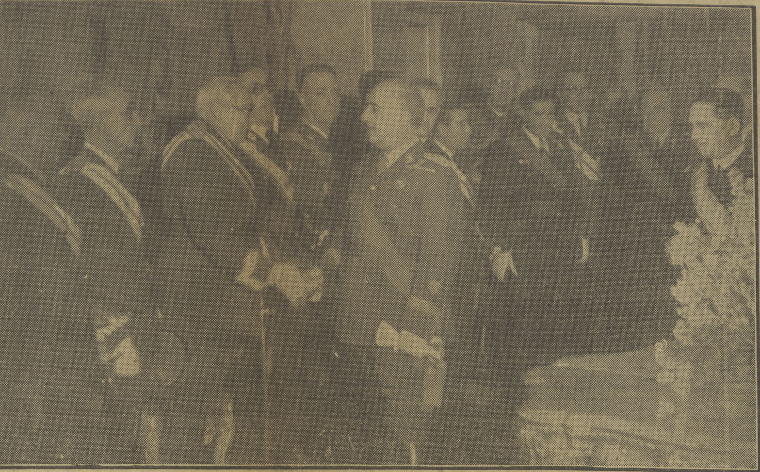
El Generalísimo Franco recibió ayer, con motivo de la celebración de la Pascua militar, la adhesión inquebrantable de los Ejércitos de Tierra, Mar y Aire.

“La debilidad y el sometimiento no traen jamás la paz, pues con el deshonor va siempre la ruina y la esclavitud”