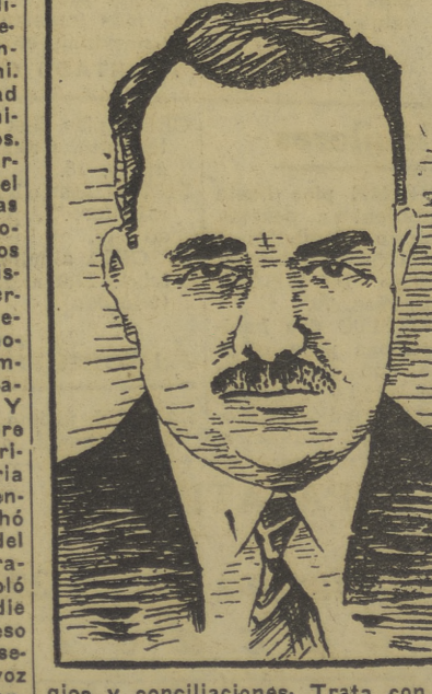
Ya está en Bengala el nuevo gobernador, Frederick J. Burrows...