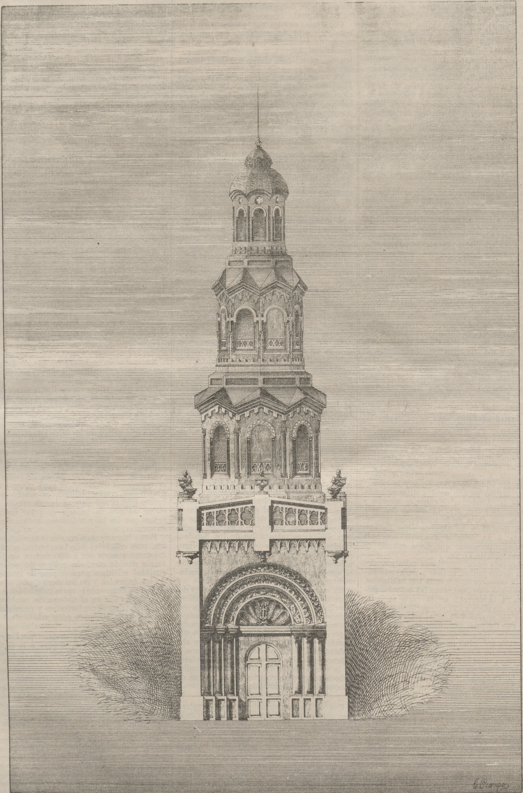
PROYECTO DE TORRE PARA LA IGLESIA DE LA CABECERA DE LA PROVINCIA DE BULACAN.