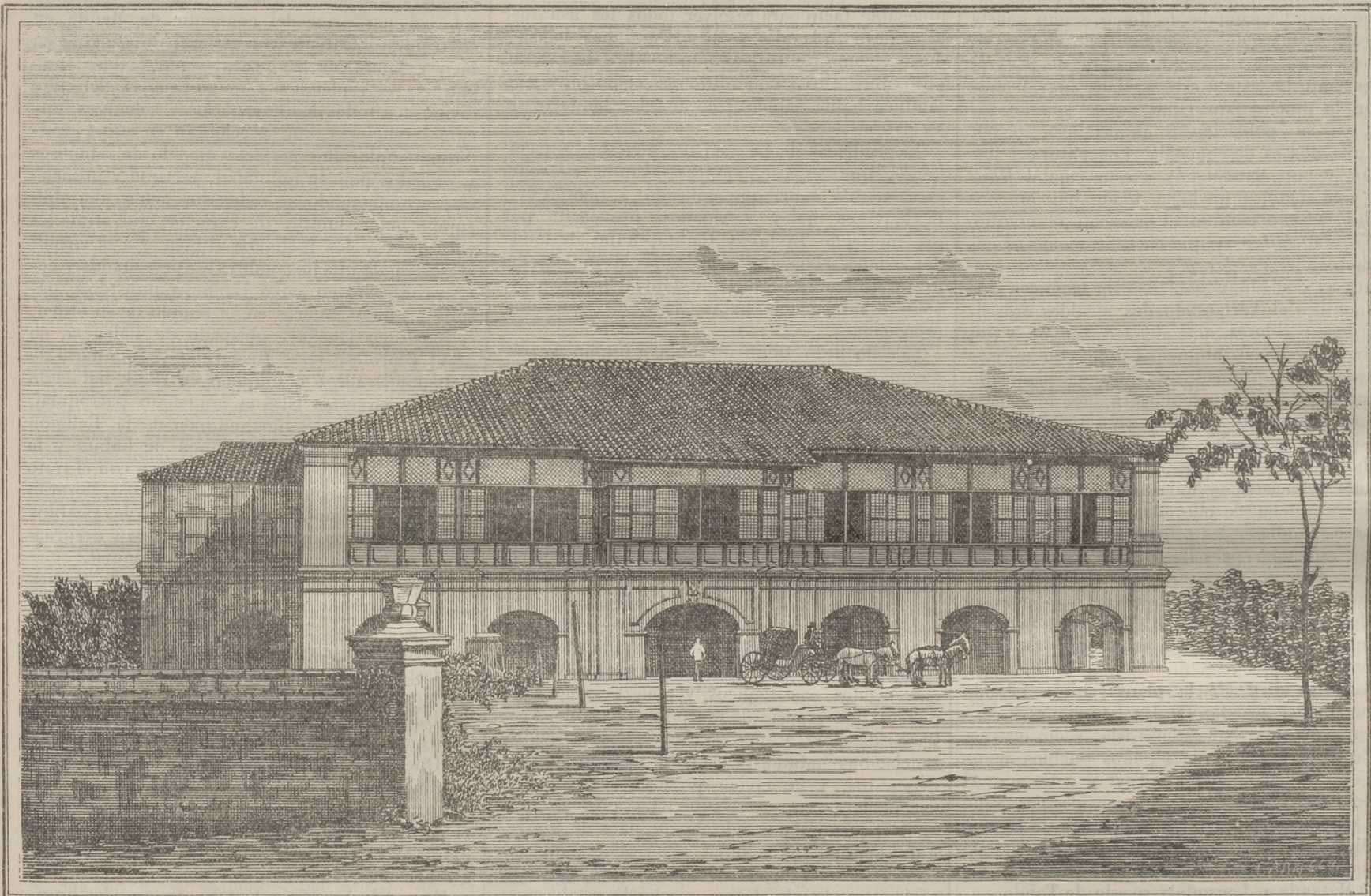
(LOCOS NORTE) CASA-CONVENTO DE BATAC.

Desde tiempo inmemorial vine reconociéndose por todos la necesidad de canalizar el rio Pasig, por ciertos sitios, donde se hace casi imposible la navegacion.