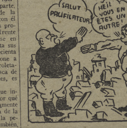
Benito esperaba entrevistarse con Hitler en... Madrid. Pero deberá contentarse con irle a ver a su casa, no se sabe cuándo, ni dónde, ni en qué condiciones.