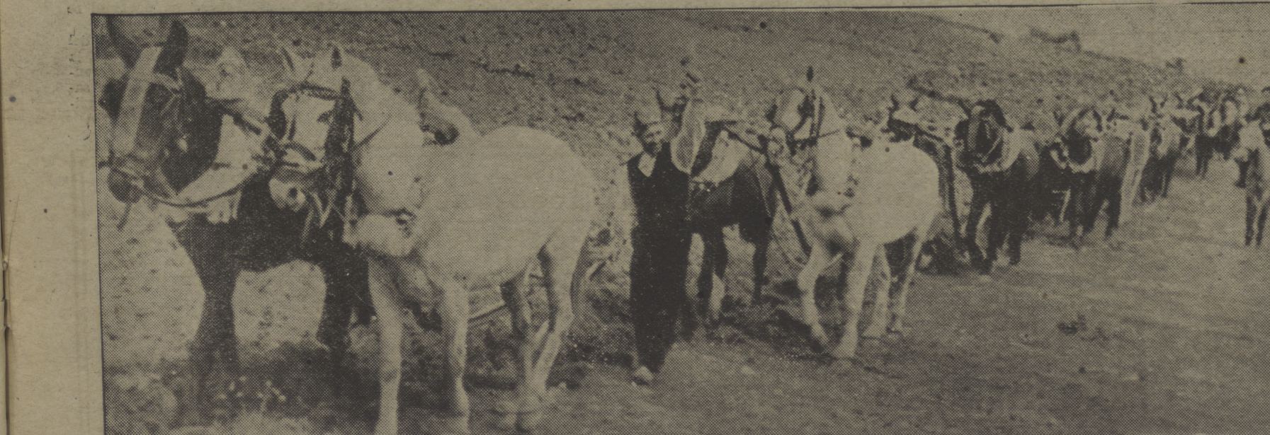
A los muchos kilómetros de los frentes, cerca de Madrid, en el horizonte del ruido del cañón y del estallar de las bombas, estos campesinos, que en la foto nos saludan con el puño en alto, trabajan con afán la tierra. Echados sobre el brazo del arado, empujan con fuerza la tierra. Esa tierra que ahora ya es suya, que trabajan en colectividad desde días, después del 19 de julio. Antes, la finca era propiedad de un señor que habitaba en Madrid y que cada seis meses venía a cobrar la cosecha de los cuarenta kilómetros de tierra y a pagar unos reales de jornal a sus pocos obreros. Ahora son los campesinos, que la hacían y la hacen rendir, los que obtienen el resultado de su trabajo. Son un millar y cobran cada uno diez pesetas diarias. Y buena parte de ello lo envían a la ciudad, para las milicias, que les defienden la posesión de esta tierra. Por esto, al ver al fotógrafo, representación de la ciudad, de la que salen los obreros que le han dado la tierra, el campesino saluda con el puño en alto...

Ayuda efectiva al proletariado español VEASE PAGINA 3 DE ESTA EDICION