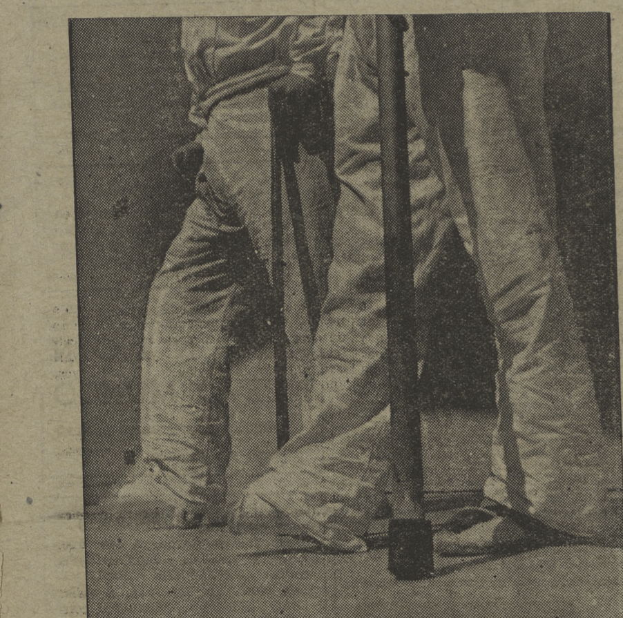
He aquí el rostro cruel de la metralla fascista. Este joven, fuerte, audaz, que ha caído en los frentes, que ha perdido su sangre o parte de su cuerpo en defensa de la Revolución...