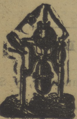
Aparato para hacer gaseosas